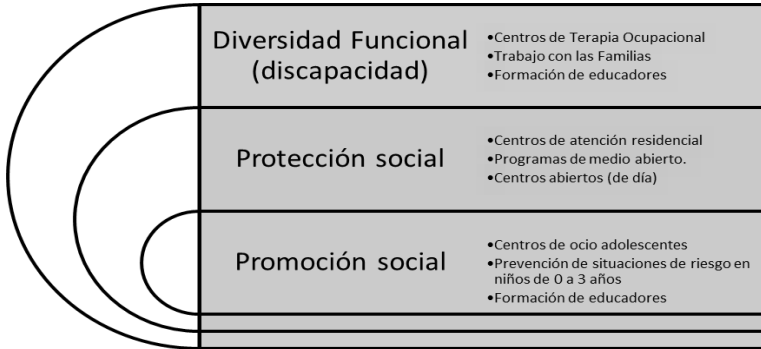
Figura 1: tipología de diversos dispositivos analizados desde la experiencia.

Desde la reflexión profesional, o la reflexión en y sobre la acción hemos buscado entender si el logro de los objetivos perseguidos en los diferentes dispositivos analizados puede estar condicionado en cierta medida por las formas de actuar y por los lugares donde se implementan las acciones socioeducativas (SCHÖN, 1987). Tal y como sugieren Contreras y Pérez de Lara: "proponerse la vivencia educativa como aquello que investigar, es proponerse, en primer lugar, estudiar lo educativo en tanto que vivido, en tanto que lo que se vive. Pero sobre todo es acercarse a lo que alguien vive" (CONTRERAS y PÉREZ DE LARA, 2010: 23).