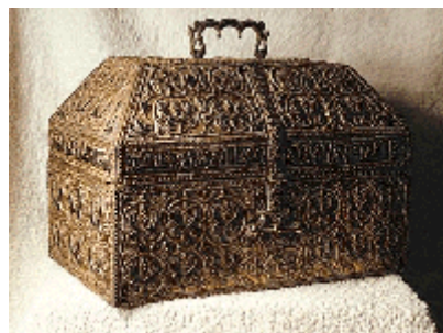
Arqueta de Hišām II. Orfebreria de plata d'època califal.