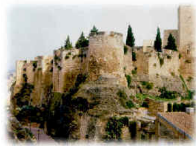
Castell de la Suda.

Una posició similar sosté R. Miravall (1973: 8-9), el qual creu que al poble hebreu se'l tolera d'un forma molt relativa i amb l'arribada dels almoràvits la seva situació empitjora per l'intransigència dels nou vinguts. Així, no ens ha d'estranyar que rebessin als conqueridors catalans amb una certa dosi d'alleujament.