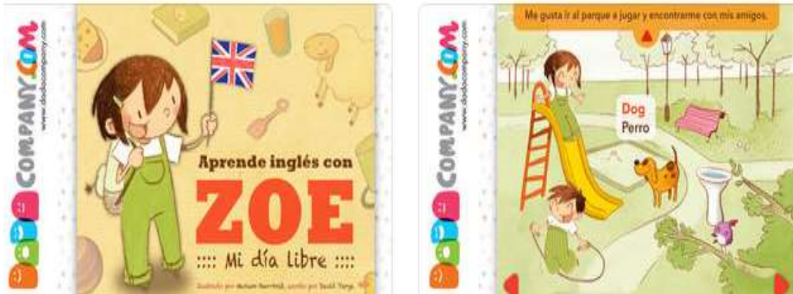
Figura 8. Aplicación Aprende Inglés con Zoe.