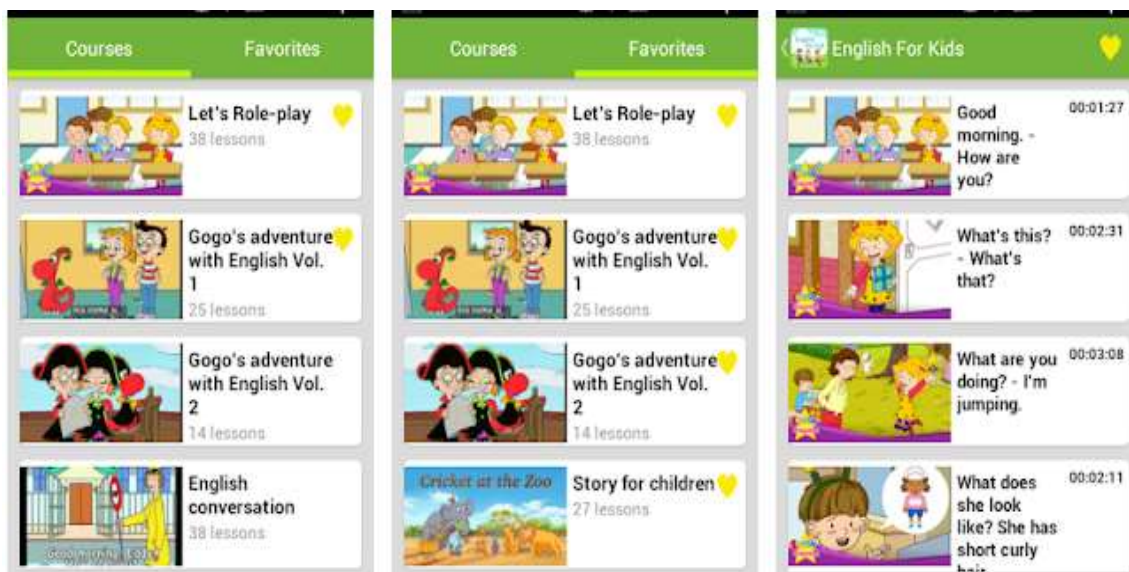
Figura 7. Aplicación Inglés para niños .