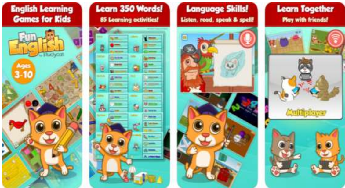
Figura 6. Aplicación Fun English, Learn English.