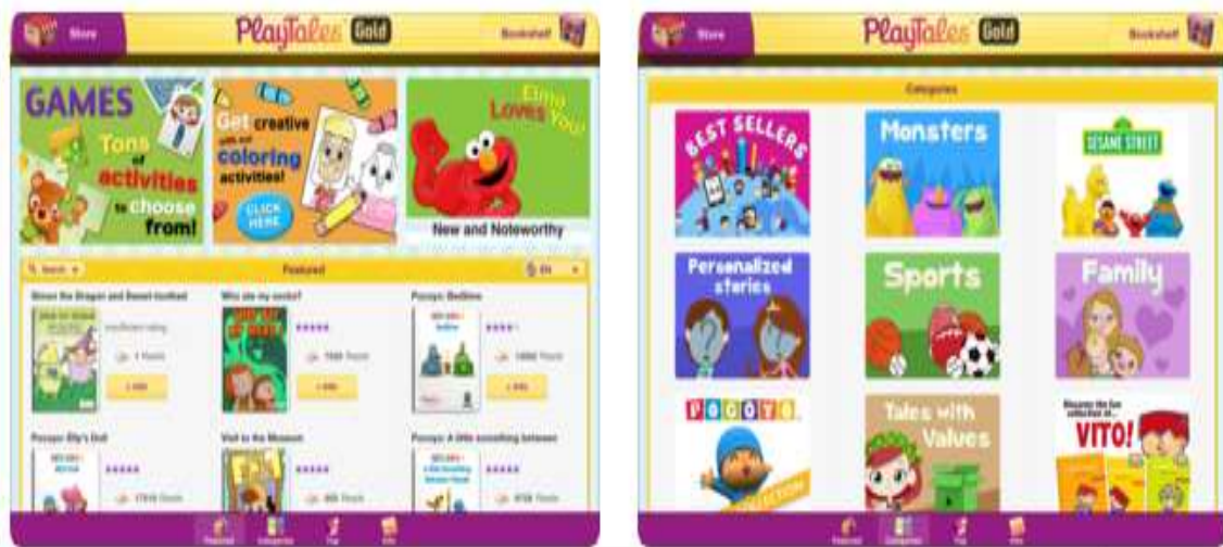
Figura 10. Aplicación PlayTales Gold.