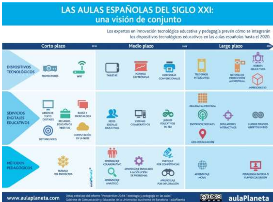
Figura 1. Previsión de la evolución de las aulas españolas del siglo XXI

elaborado en colaboración con el Gabinete de Comunicación y Educación de la Universidad Autónoma de Barcelona: