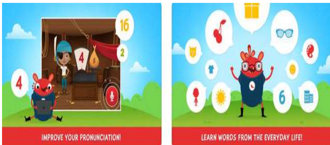
Figura 3. Aplicación Pili Pop.