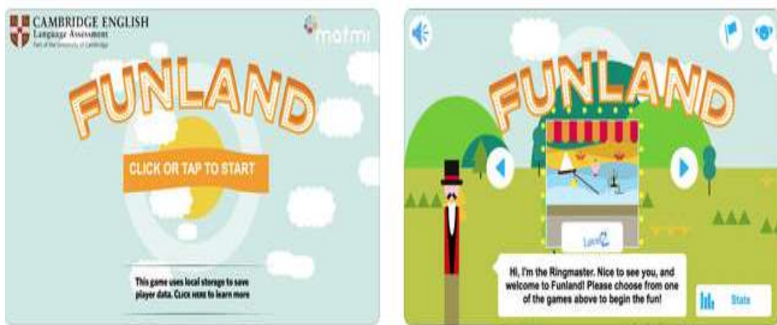
Figura 5. Aplicación Funland . (Fuente: iTunes, Apple. https://itunes.apple.com/es/app/funland/id630632324?mt=8 )