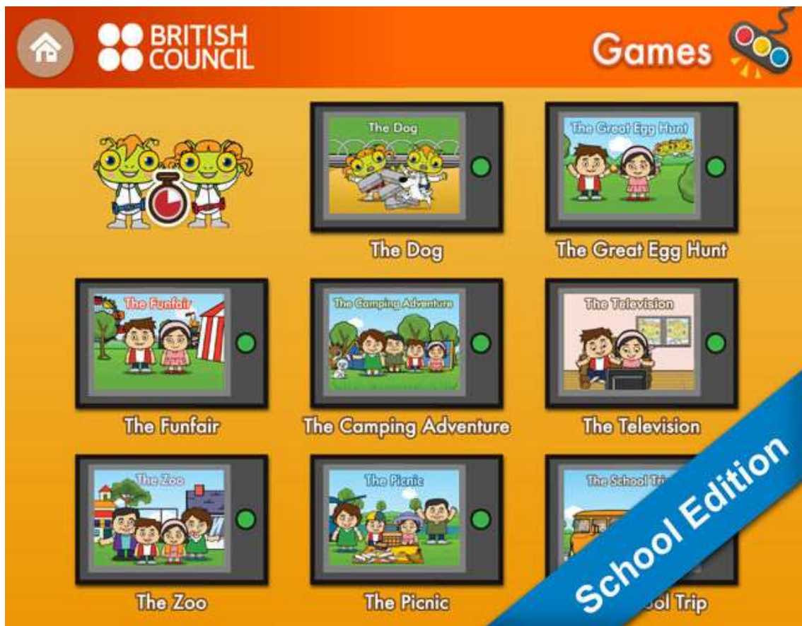
Figura 1. Aplicación Phonics Stories (LearnEnglish Kids).