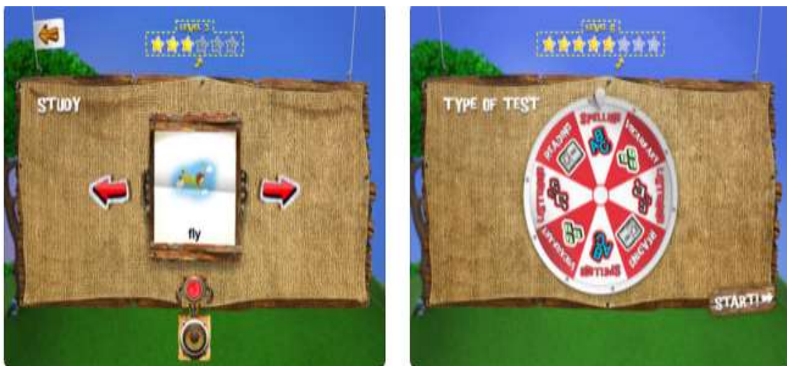
Figura 9. Aplicación EF English First High Flyers Vocab Game for Learning English 2 . (Fuente: iTunes, Apple. https://itunes.apple.com/es/app/ef-english-first-high-flyers-vocab-game-for-learning/id438876183?mt=8 )