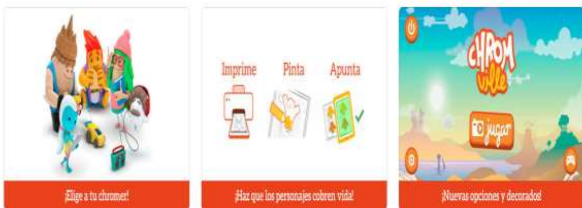
Figura 11. Aplicación Chromville.