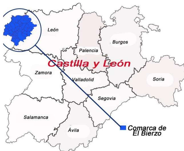
Fig. 1. Ubicación de la comarca de El Bierzo (León) en la CC.AA. de Castilla y León.

Fabero y Villablino) 21 sino a lo largo de las últimas décadas, tanto a nivel demográfico (124.000 habitantes en 2018, 8,28% menos que en 1998) como por la paulatina reducción de la minería (de 45.212 empleos directos en 1990 a unos 1.700 a finales de 2017 en el conjunto de España, y de 7.790 en 1994 a 2.634 en 2009 en Castilla y León).