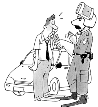
Diligències policials de difícil reproducció són, per exemple, la prova d'alcoholèmia, la filmació en videocàmera, etc.

Aquest últim aspecte planteja la dificultat d'aplicar a aquests efectes l'article 730 LECrim, ja que, com hem assenyalat, aquest precepte es refereix específicament a les diligències sumariales i no a les diligències policials.