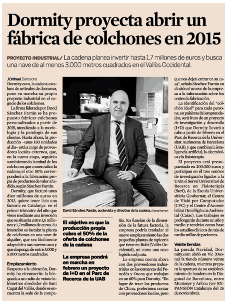
Figura 5. Article al diari Expansión , 9 de gener de 2014

Permeten establir contacte entre l'empresari i el periodista (mitjà de comunicació), especialment quan una empresa encara no es coneix públicament.