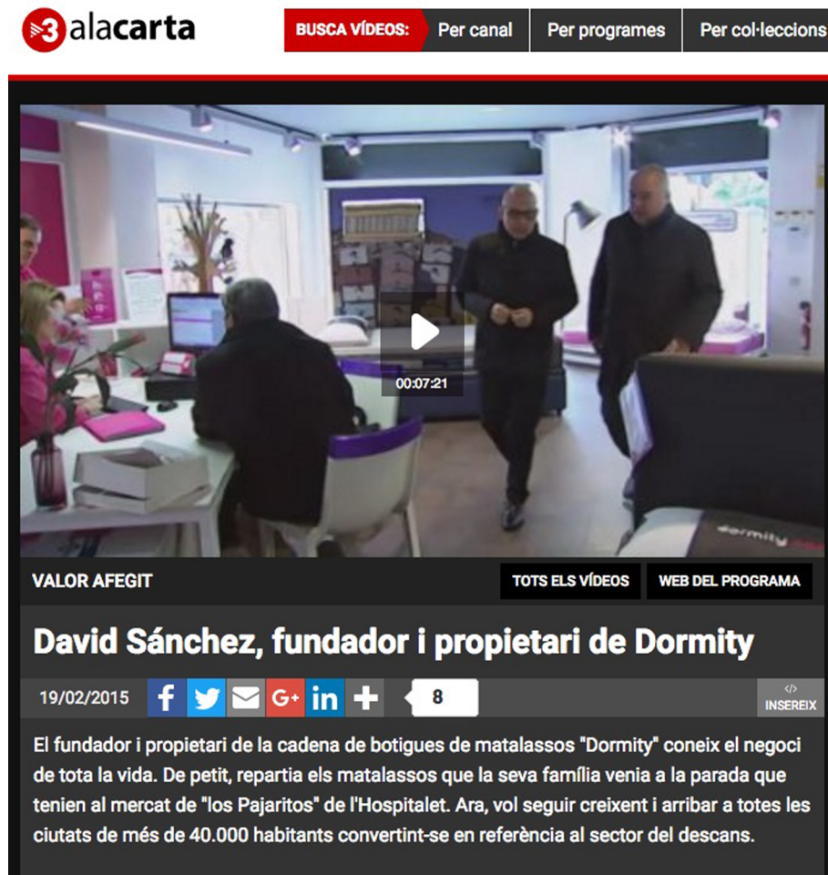
Figura 9. Reportatge sobre l'empresa en el programa Valor Afegit , de TV3