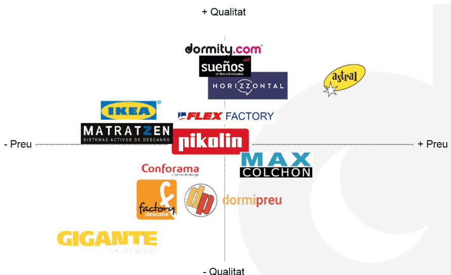
Figura 3. Posicionament de Dormity.com en el sector

A continuació es presenta el mapa de posicionament de la marca en el sector, atenent els aspectes clàssics de qualitat i preu.