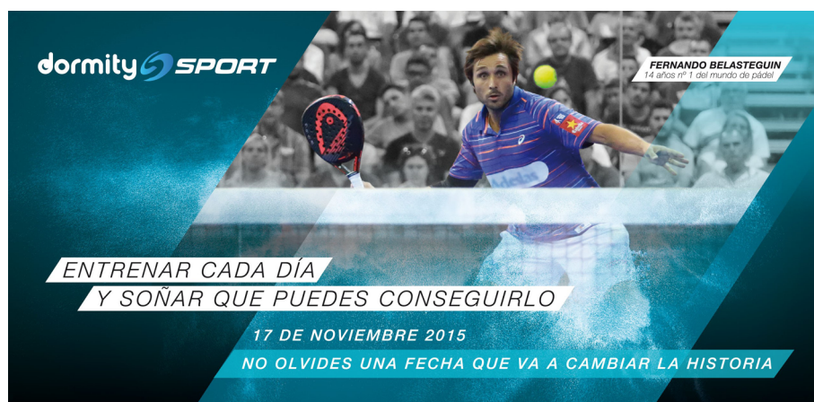
Figura 13. Exemple d'invitació