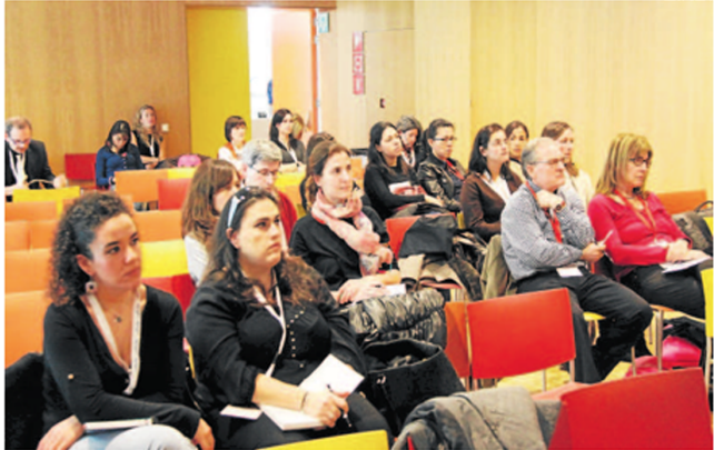
Neurólogos, otorrinos, pediatras, cardiólogos, neumólogos o psicólogos son algunos de los 200 profesionales que asistieron al congreso.

¿Qué hacer frente a un mal despertar y a los problemas de conciliación para dormir? El 88% de los letrados que participaron en el estudio realizado por la Fundación Dormity sobre la calidad del sueño en España, publicaron sus experiencias y consejos para conciliar el sueño. Los expertos coinciden en que la dificultad para conciliar el sueño, el despertar por la noche y la sensación de no haber descansado lo suficiente, la publicación de este estudio en el país, es una noticia que merece ser conocida por todos los letrados. Desde ayer y hasta mañana en La Llotja, "Dormimos poco y mal" es el tema de un congreso que se celebrará en el salón de actos de la Llotja, que reúne a 200 profesionales de la medicina y a los asistentes de la Llotja. "Dormimos poco y mal" es un congreso que se celebrará en el salón de actos de la Llotja, que reúne a 200 profesionales de la medicina y a los asistentes de la Llotja. "Dormimos poco y mal" es un congreso que se celebrará en el salón de actos de la Llotja, que reúne a 200 profesionales de la medicina y a los asistentes de la Llotja.