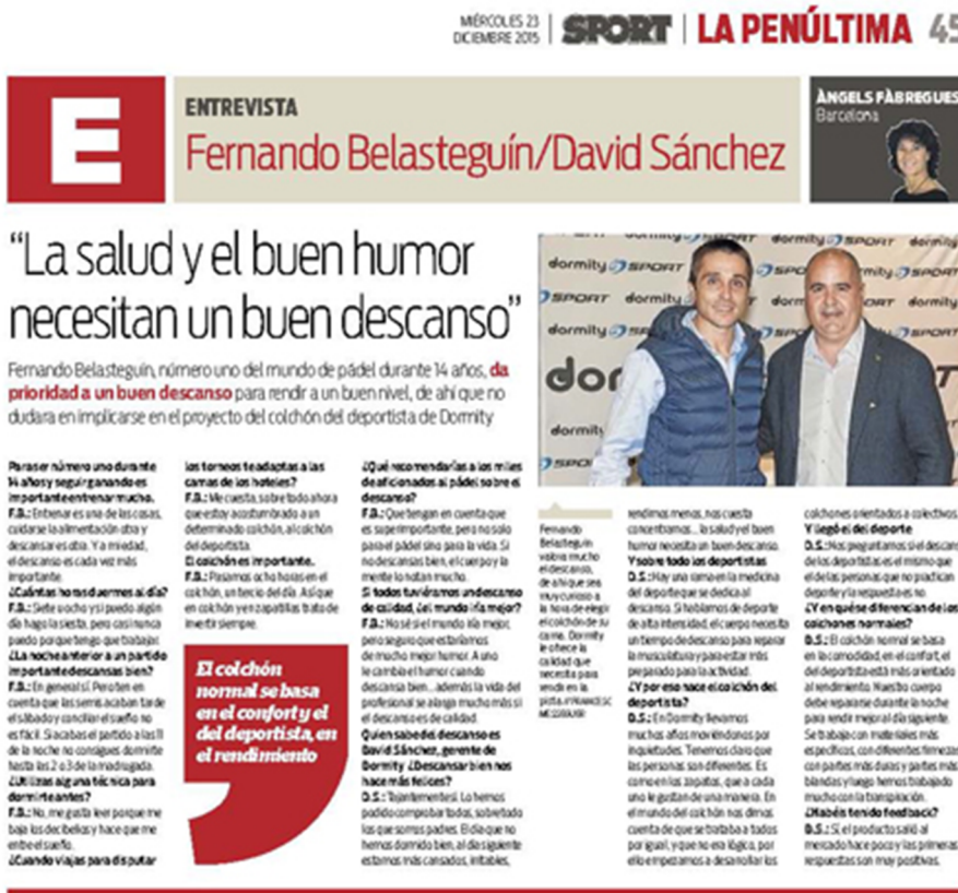
Figura 16. Entrevista al diari Sport, 23 de desembre de 2015