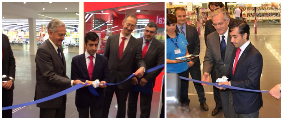
Foto de grup.

Paral·lelament, pugen els músics a l'escenari per l'escala lateral esquerra i interpreten una peça musical suau mentre té lloc el tall de la cinta inaugural. Quan s'acaba l'escena del tall de la cinta, la música augmenta de volum fins a la fi de la peça musical.