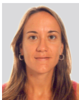
Esther Farnós Amorós

Catedràtica de Dret Civil a la Universitat de Barcelona. Magistrada de la Sala Civil del Tribunal Suprem (2005-2012) i, des del 2012, Magistrada del Tribunal Constitucional.