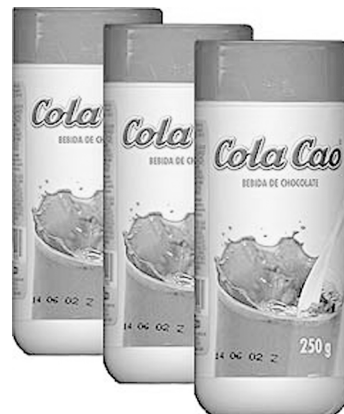
Exemple de marca tridimensional. Pot de ColaCao.

(1) L'EUIPO és l'agència europea responsable del registre de marques, dibuixos i models vàlids a tots els estats de la UE.