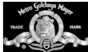
Exemple de marca. Combinació de denominativa, gràfica i sonora (tots sabeu com sona, veritat?).

Aquests signes han de servir per a distingir els productes o serveis d'altres d' idèntics o similars .