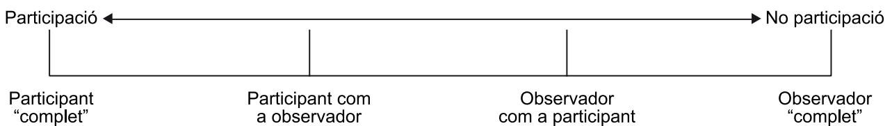
Figura 4. Classificació dels rols d'observació segons el grau de participació