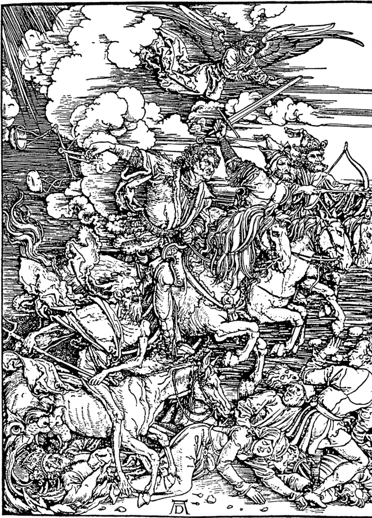
Figura 2. Els quatre genets de l'Apocalipsi.

Dedicats a guerres constants entre ells, els europeus van desenvolupar en aquests segles la tecnologia de les armes i del combat molt per sobre de la resta del món, i van transformar especialment la guerra naval amb els canons, que donaven una gran potència destructora a les seves naus. Serà precisament això el que expliqui que acabin imposant-se militarment i que aconseguixin el domini del món extra-europeu.