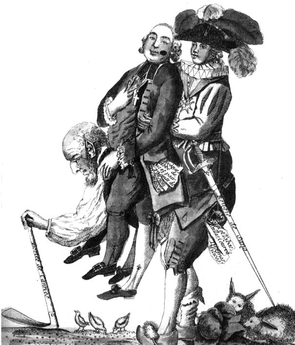
Figura 2. Els tres estats en una representació revolucionària francesa. Els que van començar a voler canviar la situació no van ésser, però, els de baix de tot, sinó els burgesos, menys oprimits però mal avinguts amb l'ordre estamental. Un predicador anglès del segle XIV havia dit: "Déu ha fet el clergat, els cavallers i els treballadors; però el dimoni ha fet els burgesos i els usurers".

Va arribar un moment, però, en què no es podia seguir sostenint la vella legitimació dels privilegis: els exèrcits europeus no estaven ja integrats pels senyors i pels homes d'armes que els seguien, sinó per soldats professionals i de lleva, de manera que els plebeus van deixar de trobar justificat el fet que els nobles estiguessin exempts de pagar impostos i rebessin una sèrie d'ingressos en nom de la teoria que feia d'ells els defensors de tots. Una de les causes inicials de la Revolució Francesa va ser el descontentament dels membres del Tercer Estat, que incloïa la burgesia, en veure's marginats del govern del país (figura 2).