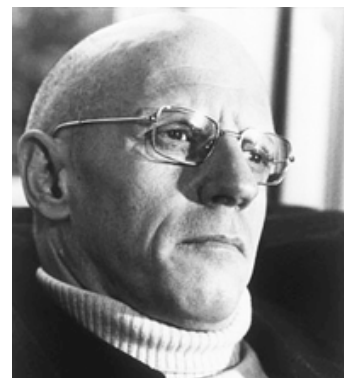
Michel Foucault (1926-1984)