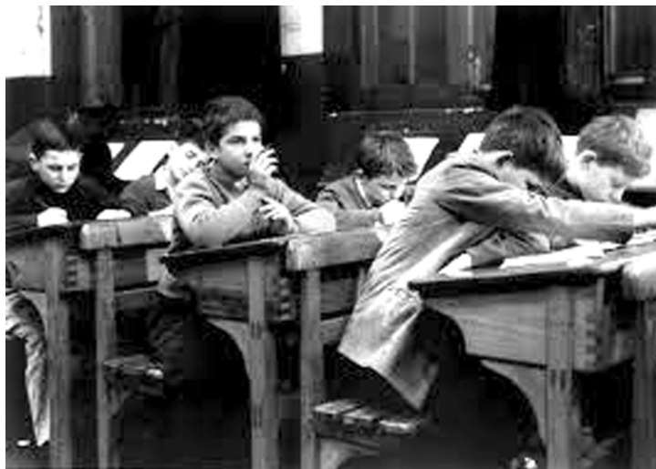
Escena de Les quatre cents coups , de François Truffaut (1959), en què el seu protagonista fa les mil i una (però també rep els revessos de la vida) en els seus intents per a escapar de la rutina i l'ordre escolar.

Així tindriem que, tant des d'una vessant més epistemològica com des d'una vessant més sociològica i concreta d'ús quotidià, les institucions són a grans trets uns elements socials que construeixen subjectivitats, amb unes estructures internes, amb una lògica de funcionament i amb un procediment elaborat que s'executa per mitjà de diferents mecanismes i dispositius.