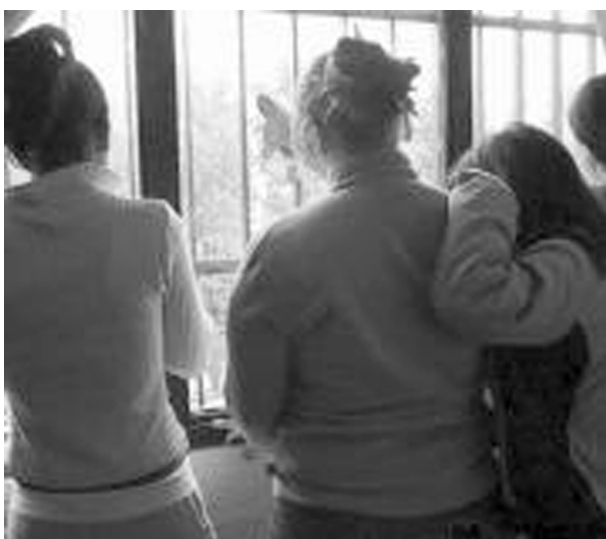
Fotografia d'unes noies internades al Centre Educatiu Els Til·lers del Departament de Justícia de la Generalitat de Catalunya en un moment de descans. Aquesta fotografia il·lustrava un reportatge del diari ABC del 26/08/2005 sobre la saturació dels centres de menors a Catalunya.

Un altre estudi que posa de manifest com els mecanismes de control actuen configurant els subjectes dins les institucions dites de "reeduació" és l'elaborat per Elisabet Alameda (2002). Hi exposa com les dones a les presons espanyoles són discriminades i classificades històricament per mitjà dels diferents mecanismes i lleis que s'han elaborat, i els donen un tractament sexista i poques vegades d'acord amb allò que s'espera de la institució.