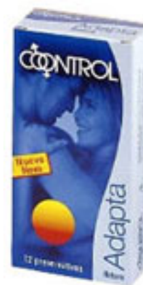
Imatge que mostra com en les relacions sexuals els mètodes anticonceptius són considerats com a mètodes de control. Encara que només controlin l'anticoncepció, també actuen com a control de les relacions sexuals.