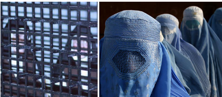
Monges de clausura i dones afganeses

En cadascuna d'aquestes religions hi ha unes figures principals que vehiculen el control sobre els seus fidels; pensem en "els sacerdots" i "els imams". Pensem com "el papa" marca les pautes del que s'ha de fer o no respecte a l'ús dels mètodes anticonceptius, i com dirigeix les conductes dels seus fidels en les seves encíclics, les seves entrevistes, els seus llibres o les seves aparicions públiques. La pauta sobre les relacions sexuals diu molt de com s'exerceix el control en els subjectes que segueixen els dictàmens del Sant Pare. En el cas del "imams" passa el mateix. Ens podem fixar en com marquen els comportaments, per exemple, per mitjà de la manera de vestir-se, un element pel qual actua el control sobre els subjectes que segueixen "fil per randa" les consignes proclamades.