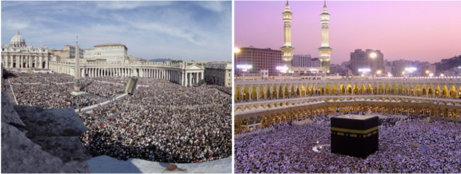
Vistes aèries de la plaça de Sant Pere i la Meca congregant multituds

Una institució que per la seva antiguitat i per la seva influència encara és necessari anomenar és la religió. Parlem especialment d'aquelles religions amb més presència en el món contemporani occidental, principalment la religió catòlica i la religió islàmica.