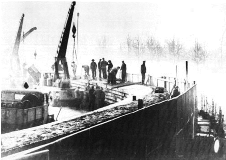
Figura 3. Construcció del mur de Berlín el 1961