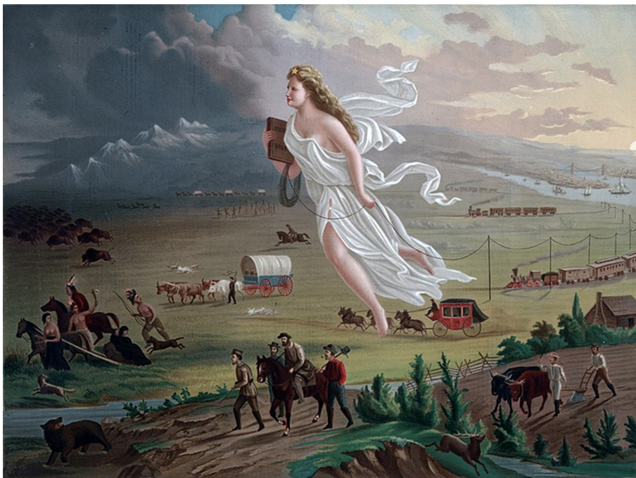
Figura 4. John Glast, American Progress (1872)