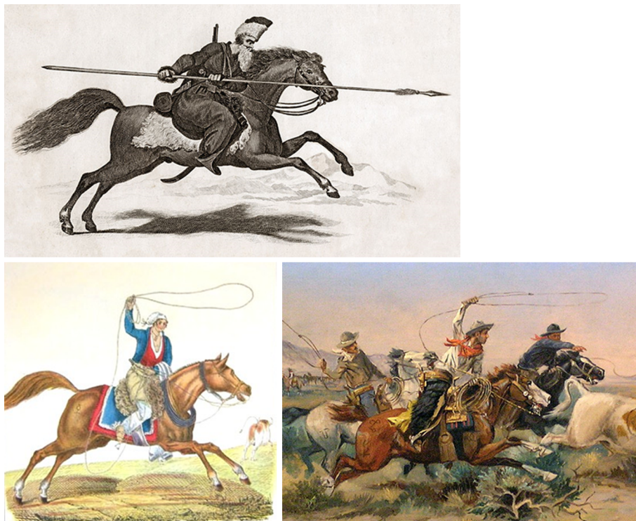
A dalt: un cosac de l'àrea del riu Don a començaments del segle XIX. A baix a l'esquerra: Gaicho enlazando , de César i Andrea Bacle, ca. 1835. A baix a la dreta: Cowboys ; fragment de The Herd Quitter , de C. M. Russell, 1897.

El cowboy i el cosac serien també comparables pel que representen. En aquest sentit, cal matisar que en altres zones del món també s'ha desenvolupat un imaginari sobre l'home de frontera, al qual es relaciona amb atributs de masculinitat, valentia i esperit aventurer. Per exemple, a l'Argentina es troba el cas dels gauchos , genets que duïen vides seminòmades i eren hàbils amb el bestiar.