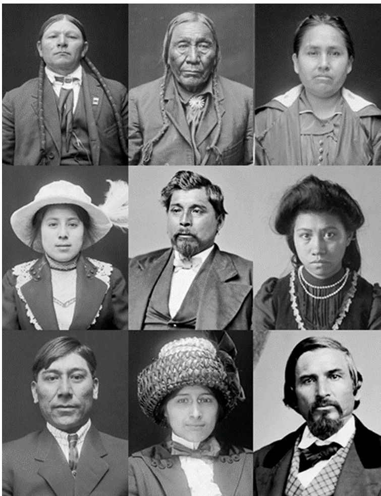
Figura 7. Nadius americans

Selecció de retrats de nadius americans de les comunitats cherokee, xeiene, choctaw, comanxe, iroquesa i muskogee, amb vestimenta europea. Fotografies entre 1868 i 1924.