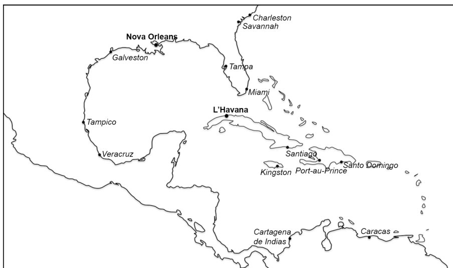
Figura 8. Mapa del Gran Carib

gràficament s'ha posat en comú per a parlar de viatgers, malalties, menjar i, fins i tot, règims polítics. Hi ha hagut múltiples intercanvis i connexions en aquesta regió, l'empremta dels quals és palpable avui dia.