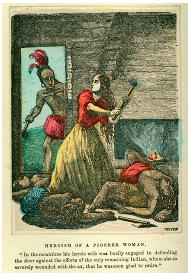
Figura 5. Henry Howe, Heroism of a Pioneer Woman (1860)