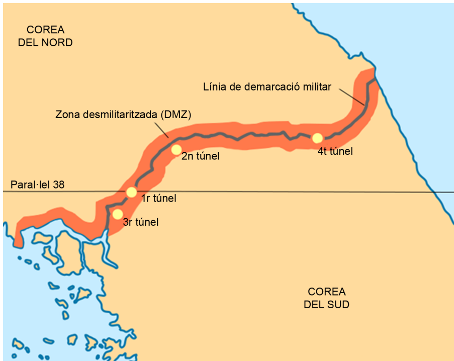
Figura 2. Divisió de Corea pel paral·lel 38 que creava Corea del Nord i Corea del Sud