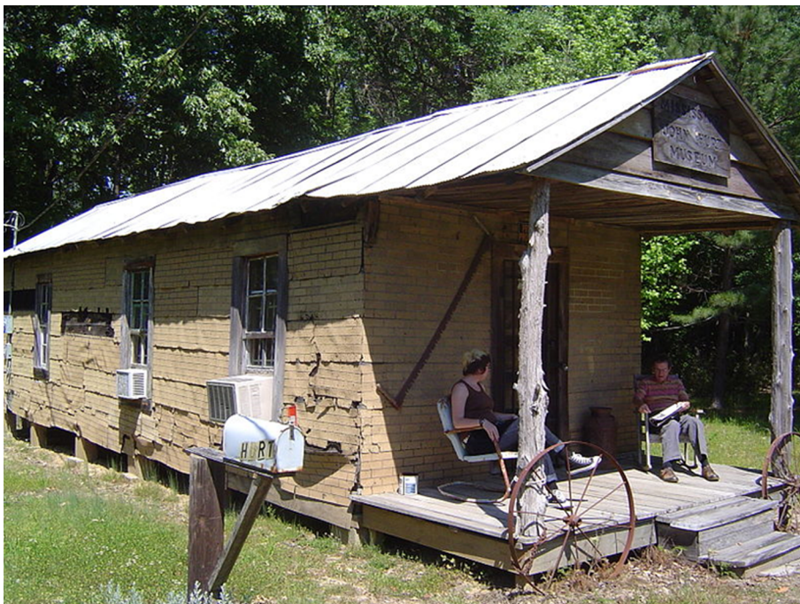
Figura 9. Típica casa shotgun del sud dels Estats Units

Molts d'aquests individus s'instal·laren a Nova Orleans, fins al punt que la ciutat va doblar la seva població. Una vegada allà, aquests refugiats emularen el sistema de construcció de la seva terra natal, ja fos per nostàlgia o perquè era el sistema que coneixien i utilitzaven. Per afegir-hi més connexions, a més, les cases típiques de Port-au-Prince al seu temps havien estat construïdes amb xiprers de Louisiana (Edwards, 2009, pàg. 62-96).