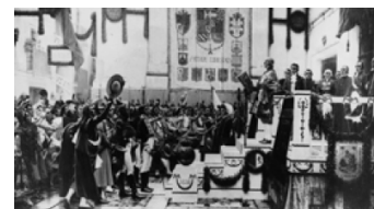
Promulgació de la Constitució de Cadis segons el quadre de Salvador Viniegra.

Dins de la ciència política cal entendre per conductisme aquella escola de pensament que orienta les seves recerques politològiques inspirant-se en les concepcions teòriques de l'escola psicològica homònima, atès que és en la psicologia on el conductisme es desenvolupa en un primer moment.