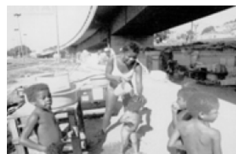
Nens que viuen en condicions pèssimes en un barri suburbà de Rio de Janeiro.

D. C. North (1990). Institutions, Institutional Change and Economic Performance . Cambridge: Cambridge University.