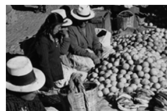
Mercat indígena al Perú

La famosa "mà invisible" (1776) d'Adam Smith o "la faula de les abelles" (1714) de Bernard de Mandeville són precedents clars de la idea que la consecució egoista dels objectius individuals en uns determinats contextos institucionals produeix l'enriquiment del conjunt de la societat (les abelles, buscant el seu propi benestar, són les principals artífexs del benestar de l'eixam). És a dir, la racionalitat individual coincideix en aquests casos amb la racionalitat col·lectiva.