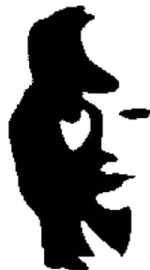
Home tocant el saxo o cara de dona?

En un sentit ampli, fa referència als costos que impliquen el fet de negociar i garantir els acords que es donen entre els individus. En un sentit més estrictament econòmic, es tracta dels costos de redacció i aplicació de qualsevol contracte. En ciència política també s'utilitza aquest concepte per a fer referència als costos d'elaboració, negociació, implementació i garantia de compliment de les decisions del govern.