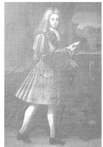
Retrat de Felip V (1701). Museu del Prado Madrid.