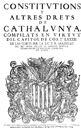
Portada del volum primer de les Constitutions y altres drets de Cathalunya de 1704.

Una novetat de la compilació és l'extensió de la sistemàtica medieval del Codi de Justinià a tots tres volums de l'obra, dividits en deu llibres. Cada llibre era dividit en títols, i els títols contenien els capítols (cada un dels textos compilats).