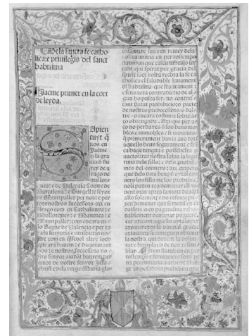
Pàgina miniada de les Constitutions de Catalunya .

El 1564 els estaments van demanar que les constitucions, els capítols i actes de cort, els Usatges i altres lleis de la terra s'haguessin de col·locar en títols adequats i degudament ordenats, indicant-ne els superflus i corregits.