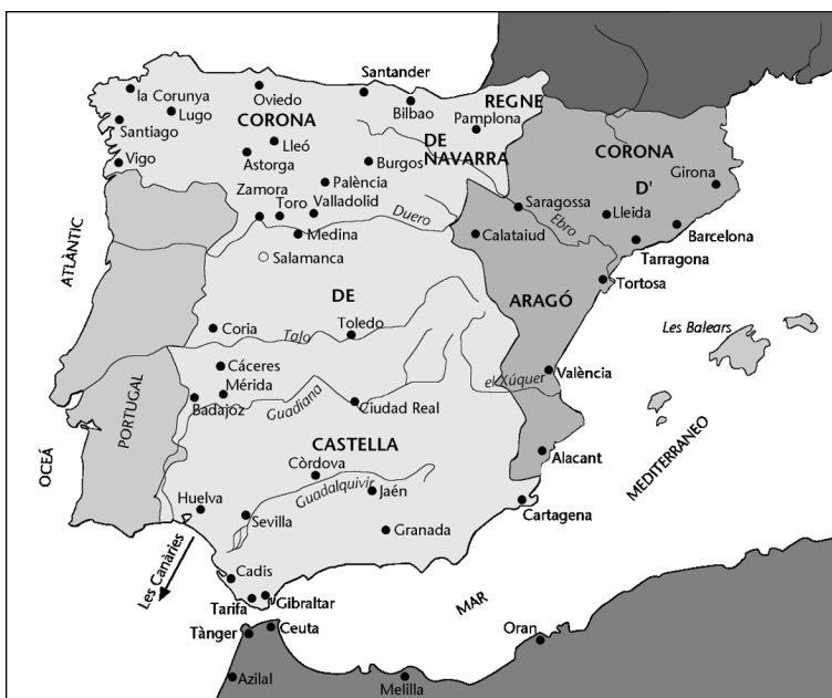
L'Espanya dels Reis Catòlics

Aquest poder d'un únic sobirà va ser l'element identificador de l'estat unitari. Però tot i que els reis, des d'Isabel i Ferran, van intentar afirmar la seva sobirania, es van haver d'enfrontar als poders baixmedievals per tal d'aconseguir el seu objectiu: la consolidació d'un poder absolut i perpetu que no tingués més límits que les lleis de Déu i de la raó. En la seva actuació el sobirà podia actuar lliurement, i lliurement podia triar el manteniment del dret del passat, però com que el seu poder era absolut, també el podia modificar i derogar. Tanmateix, el sobirà no havia d'actuar arbitràriament, i per això s'havia de sotmetre als principis religiosos, mitjançant la raó d'Estat.