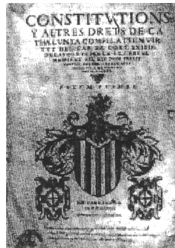
Portada del primer volum de les Constitutions y altres drets de Cathalunya de 1588-1589.

Atesos els precedents, el 1585 es demana al monarca que es revisi i es faci novament la compilació, i que nomeni tres persones que juntament amb les nomenades pels estaments la duguin a terme, col·locant les constitucions i els capítols de cort als llocs corresponents i separant els superflus i els corregits. També es demana al rei que feta l'obra, lliurada una còpia signada al lloctinent general (per a l'arxiu reial) i una altra als diputats (per a l'arxiu de la casa de la Diputació), els diputats la puguin imprimir sense noves consultes al monarca. El monarca s'hi avé i nomena els seus oficials el 1587.