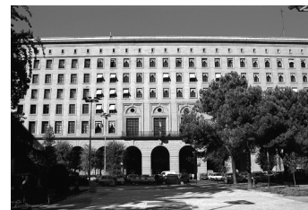
Seu del Ministeri de Treball a Madrid.

Pel que fa al paper del reglament dins l'actual model de distribució de competències entre l'Estat i les comunitats autònomes, vegeu el subapartat 3.4 d'aquest mòdul didàctic.