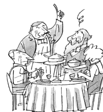
La STC 170/1987 sobre l'aspecte dels empleats d'hosteleria és un exemple de l'ús d'un costum local com a font del dret del treball.

J. López López (1993). Marcos autonómicos de relaciones laborales y de protección social (pàgs. 75-94). Madrid: Marcial Pons.