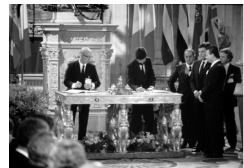
Moment de la signatura del tractat d'adhesió d'Espanya a la Unió Europea.

J. López; B. Caruso; M. Fredland; K. Stone (2011). La aplicación de la OIT por los jueces nacionales: el caso español desde una perspectiva comparada. Editorial Bomarzo.