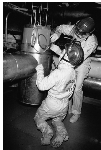
La perillositat del treball comporta un complement salarial.

a) Complements de lloc de treball . Es reconeixen per raó de les condicions materials en què es du a terme el treball (per exemple, plus per treball penós, perillós o tòxic).