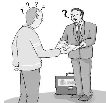
En el sistema actual d'aplicació dels tributs, és imprescindible controlar l'actuació dels obligats tributaris.

Les actes són els documents emesos per la inspecció que posen fi al procediment i poden tenir un contingut doble: la declaració del fet que la situació tributària comprovada o investigada és correcta, o en cas contrari, la proposta de liquidació. La classificació principal de les actes atén al criteri de la conformitat o disconformitat de l'obligat tributari o de l'acord a què s'arribi amb l'Administració, que té efectes en la reducció de l'import de la possible sanció que se li imposi.