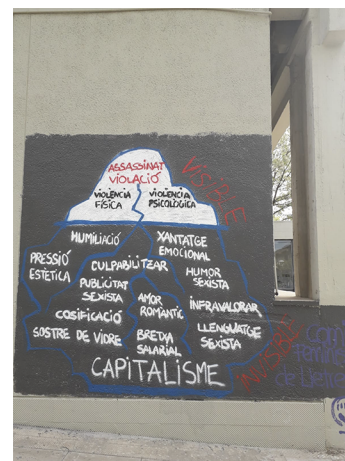
Mur d'una universitat, amb l'iceberg de la violència tal com s'ha difós des de diferents col·lectius feministes.

Si ens focalitzem en les violències sexuals, podem veure que la comprensió que se'n fa des del dret ha viscut canvis, però que encara parteix d'una base eminentment patriarcal. Actualment, la llei catalana Llei 5/2008, del 24 d'abril, del dret de les dones a erradicar la violència masclista se centra en els drets de les dones, que impliquen que les violències sexuals són il·legítimes o prohibides. Pot semblar una obvietat i, d'altra banda, hi ha crítiques a la manca de lleis que protegeixin els drets dels homes de la mateixa manera. Però... per què és important especificar els drets de les dones, en aquest cas? El dret de l'Estat espanyol es basa en el dret romà , és a dir, en principis patriarcal i heteronormatius des dels quals s'entenia que els homes eren propietaris de les