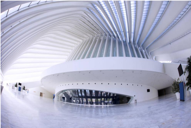
Zona expositiva del Palacio de Congresos de Oviedo