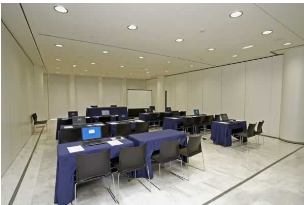
Sala de reunión del Palacio de Congresos de Oviedo

Nota. Adaptado de Turismo Oviedo [Fotografía]. ( https://www.visitoviedo.info/congresos/sedes/pec )