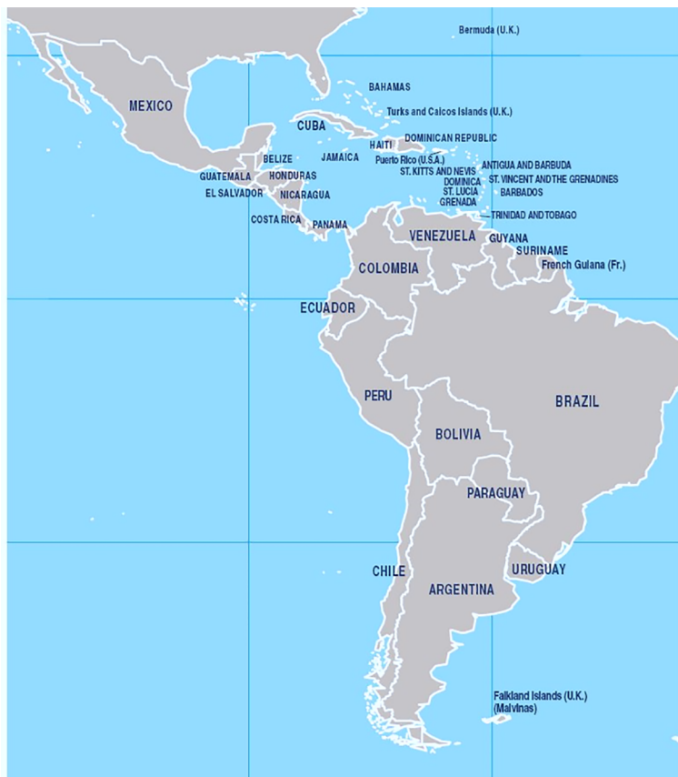
Figura 1. Mapa polític de l'Amèrica Llatina