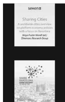
Figura 2. El llibre "Sharing Cities: A worldwide cities overview on platform economy policies with a focus on Barcelona" (Ciutats col·laboratives: Una prospectiva global de polítiques en economia de plataforma amb el focus a Barcelona) recull els resultats de les investigacions realitzades per Dimmons sobre les polítiques públiques que fomenten l'economia de plataforma arran del món i al voltant de les qualitats democràtiques de l'economia de plataforma col·laborativa a Barcelona.

Per aquest motiu, és important tenir un instrument que permeti una anàlisi amb el focus en les pràctiques, rigorós i holístic, dels elements que s'estructuren al voltant de l'economia de plataforma.