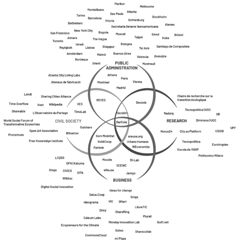
Figura 3. La cimera va ser un reflex també d'aquesta lògica amb la participació d'una pluralitat d'actors.

Si explorem per àmbits, podem identificar casos que, dia a dia, escalen el seu impacte en tots els àmbits. L'estudi identifica 25 àrees d'activitat on l'economia de plataforma hi és present. Així, Som Mobilitat, amb més de mil persones associades, sis grups locals constituïts i una vintena que s'estan activant o treballant per activar serveis, constitueix una alternativa de mobilitat responsable. Per la seva banda, Katuma en l'àmbit del cooperativisme agroecològic, permet l'articulació entre productores i cooperatives de consum. Actualment, 65 productors i 48 grups i cooperatives de consum agroecològic estan registrades. Tant Som Mobilitat com Katuma són plataformes que vinculen les seves comunitats en la governança, afavorint el creixement del mercat social i a partir dels principis cooperatius i dels comuns digitals.