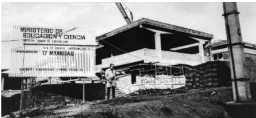
Construcció de l'escola del XUP 1973.

A l'actualitat en aquesta escola, coexisteixen diferents cultures, hi ha un 80% d'immigració i alumnes amb greus problemes familiars.