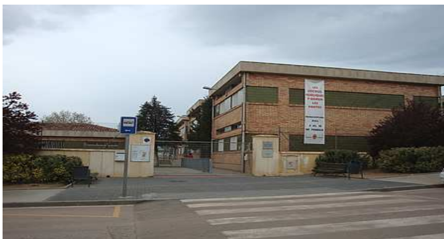
Escola del Xup, porta principal.

Vaig anar a l'escola el dia 13 de febrer, a les 8: 45h. L'edifici és molt vell i de construcció antiga com la resta d'habitatges del barri. No s'ha fet pràcticament cap obra de millora o de manteniment, llevat de petites intervencions, com ara canviar tots els vàters de l'escola, ara fa dos anys.