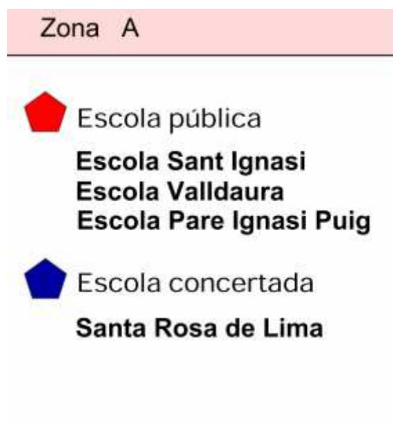
Foto plànol mapa escolar Manresa.

Tal i com veiem al mapa el Xup es troba situat en una zona on hi ha altres escoles, no és zona única, però com que queden tantes places lliures hi pot anar tothom, visqui on visqui de Manresa, si l'administració en aquest cas la OME (oficina municipal d'Ensenyament) així ho decideix.