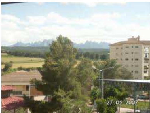
Vistes del barri el Xup rodejat de camps.