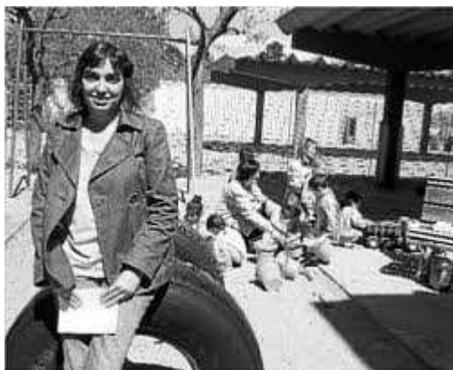
Pati de l'escola bressol "El Solet" Regió 7