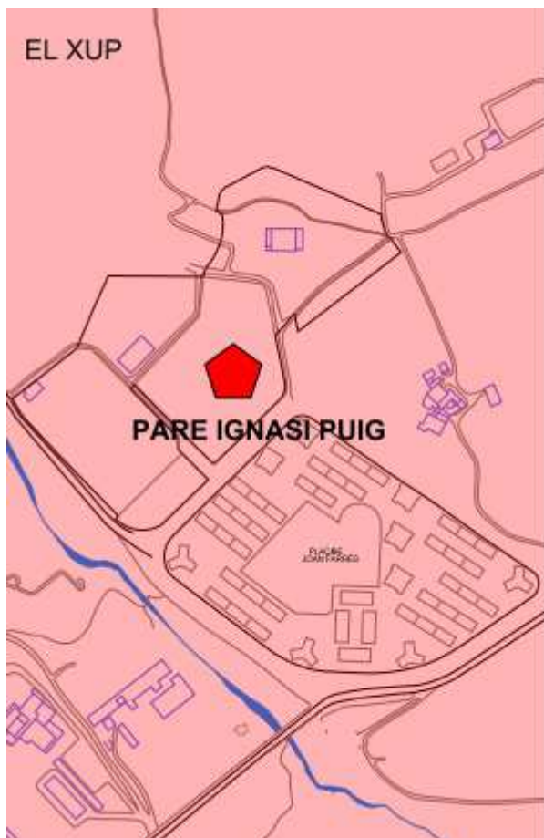
Plànol mapa escolar.