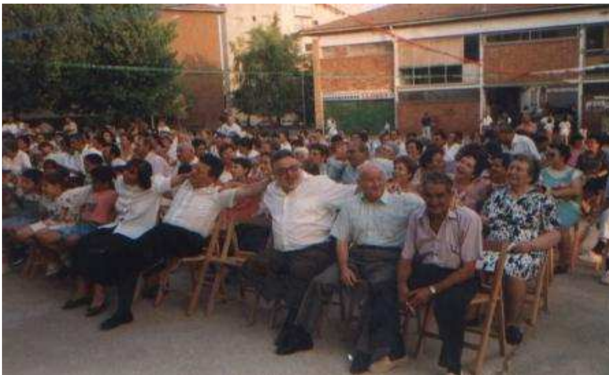
Veïns del barri del Xup.