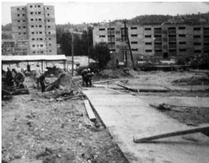
Construcció del barri, 1966. Conte 1995.