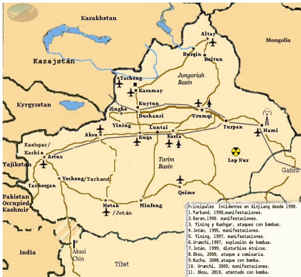
Fig. Núm 5. Mapa de los mayores incidentes violentos en Xinjiang en la primera década del siglo