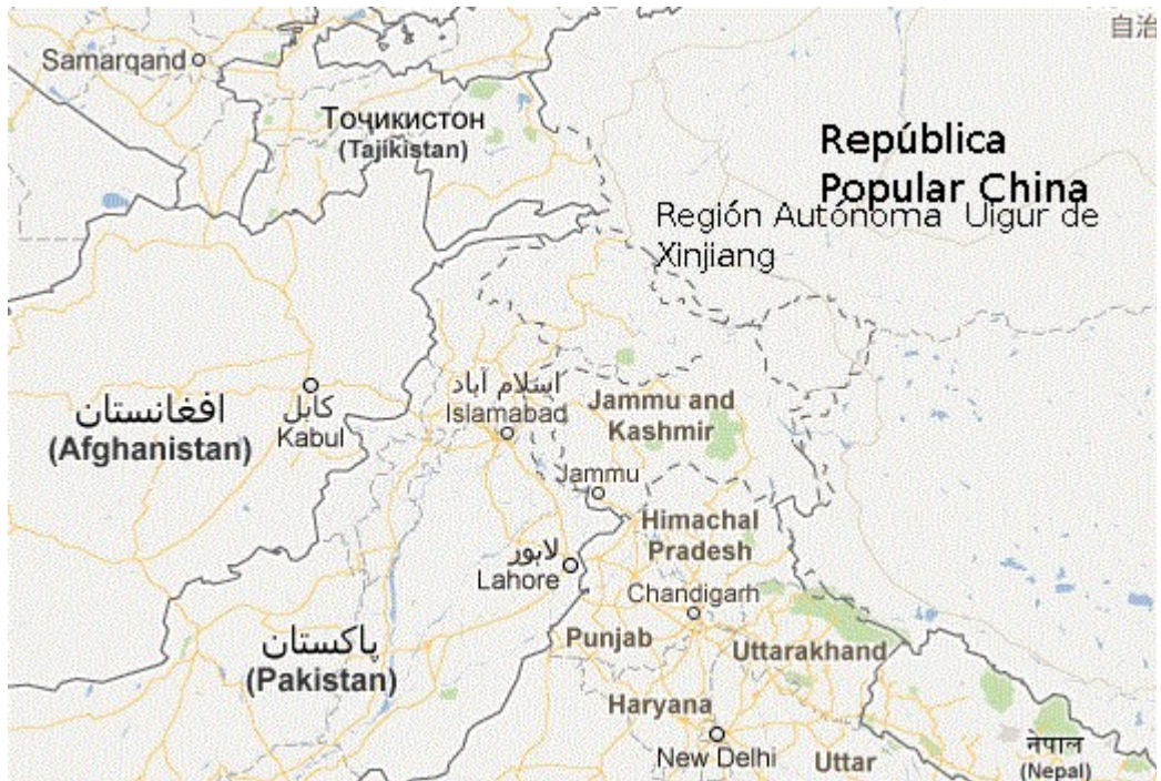
Fig. Núm 6. Mapa de la Frontera entre China, Afganistán y Pakistán