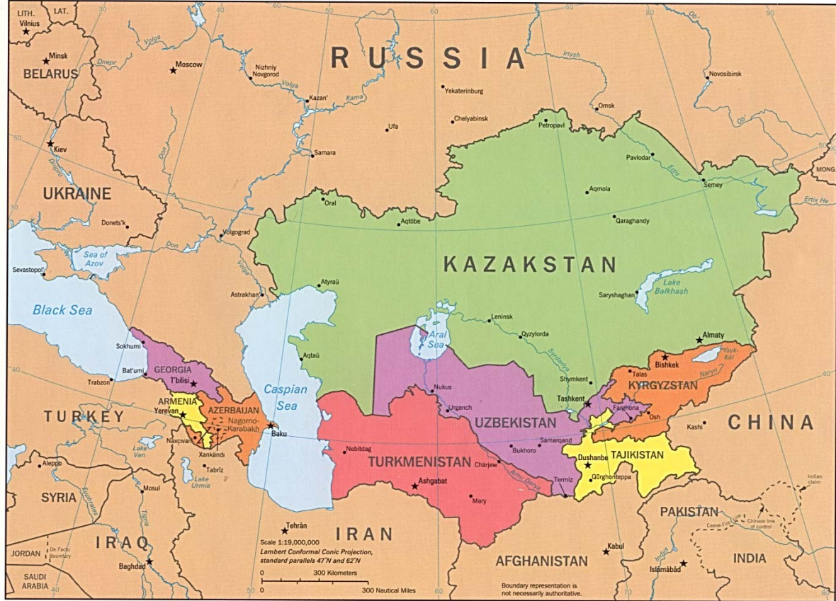
Fig. Núm 4. Mapa de los Estados de Asia Central.