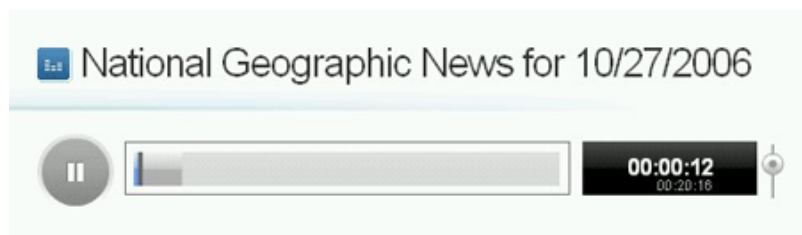
Podcast alojado en Odeo.

En los sistemas de podcast no hay que visitar la página de origen para escuchar el archivo de audio, sino que simplemente hay que pulsar un botón para reproducirlo.