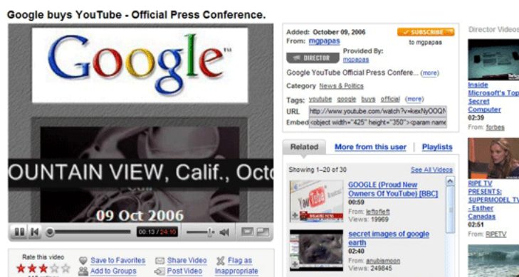
Videopodcast alojado en Youtube

Los videoblogs (o vBlogs) se alimentan de este tipo de archivos, que son alojados en espacios como YouTube, Google Video, Yahoo! Video o MSN Video.