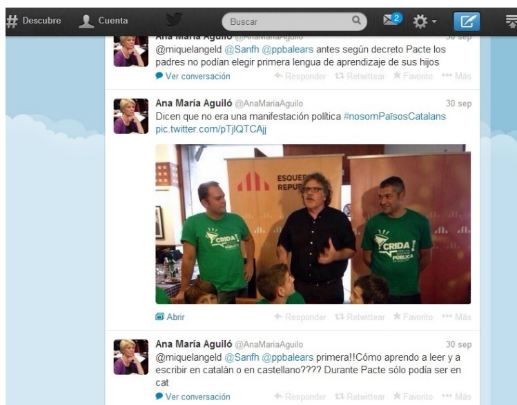
Fig. 5. Consulta Twitter personal diputada PP Aina M. Aguiló (octubre, 2013)

Unes declaracions que aixequen polèmica a la premsa local i a les xarxes socials. A la xarxa hi ha poca interacció per part dels representants polítics que governen però és veritat que l'oposició (PSIB, PSM, PI, ERC, UPYD) respon contínuament a les manifestacions que es fan a les xarxes socials mostrant diàleg amb les peticions.