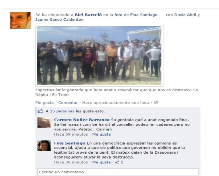
Fig 3. Consulta Facebook Diputat PSM-ENTESA Biel Barceló (abril 2012)

El treball planteja el silenci en molts casos com l'opció triada pels polítics. Les crisis de comunicació demostren que en certs casos surt més a compte callar i evitar un cert posicionament polític. En aquest punt hi juga un factor clau l'estratègia dels caps de comunicació. Els mateixos polítics expliquen que als comentaris negatius de l'oposició no els donen peu a respostes. La plana major del PSM-Entesa apareix a la fotografia del Facebook amb el comentari de l'espectacular gentada que hem anat a reivindicar que no es destrueixi Sa Ràpita. Interacció d'una ciutadana amb la política Fina Santiago: “No teniu vergonya, la llei és la que mana”.