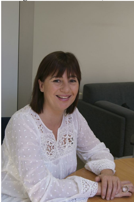
Secretària General PSIB-PSOE, Francina Armengol