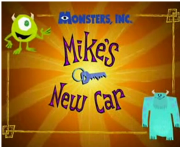
Mike's new car

http://www.youtube.com/watch?v=liQoq7_YPEc