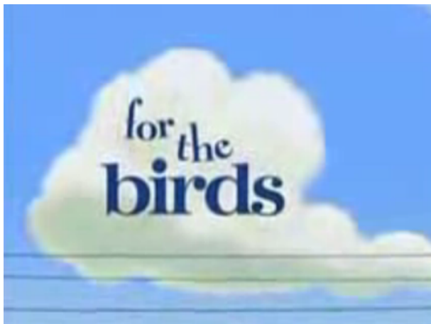
For the birds

http://www.youtube.com/watch?v=yJzQiemCluY