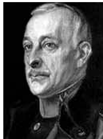
Miguel Primo de Rivera

Aprofitant el clima d'inestabilitat social i política, el capità general de Catalunya, Miguel Primo de Rivera (1870-1930), féu un cop d'estat el setembre del 1923 i inicià una etapa de set anys de dictadura personal.