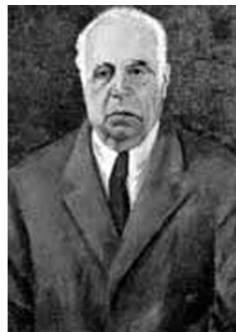
Eugeni d'Ors i Rovira

En el Glosari , D'Ors començava a elaborar unes idees i una estètica, que ell mateix designaria amb el terme noucentisme , les quals foren decisives en les orientacions polítiques del moment. Paral·lelament, Enric Prat de la Riba recollia el seu ideari, també el 1906, en La nacionalitat catalana i accedia a governar la Diputació de Barcelona, des de la qual creà el 1907 l'Institut d'Estudis Catalans i, com a dependència d'aquest, la Biblioteca de Catalunya.