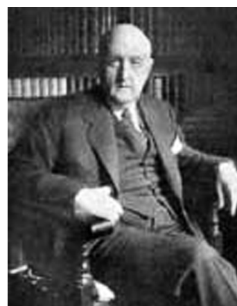
Josep Maria de Sagarra