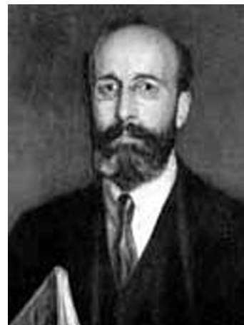
Ramón Menéndez Pidal

Els principals intel·lectuals castellans de l'època (Miguel de Unamuno, Ramiro de Maeztu, Ramón Menéndez Pidal, Pío Baroja, José Ortega y Gasset, Claudio Sánchez Albornoz, Salvador de Madariaga, Américo Castro, etc.) veien amb una indissimulada animadversió els avenços polítics, socials i culturals de la llengua catalana, sobretot a partir de la cooficialitat lingüística reconeguda per l'Estatut. Amb èmfasis i matisos diversos, gairebé tots coincidien en arguments reiterats fins avui: la conveniència de no alterar l'estatus diglòssic del català, llengua de l'emotivitat que es "degradaria" amb l'ús públic i l'accés a l'alta cultura.