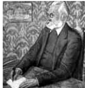
Miguel de Unamuno

La recuperació política del catalanisme verificada amb la República reobrí els recels històrics que no s'havien acabat d'apaivagar. El "tema de España" i el seu correlat, "el problema catalán", amb què els intel·lectuals del 98 havien bastit un discurs profundament castellanista, reaparegué el 1931 durant el procés constituent i uns mesos després amb el debat sobre l'autonomia de Catalunya.