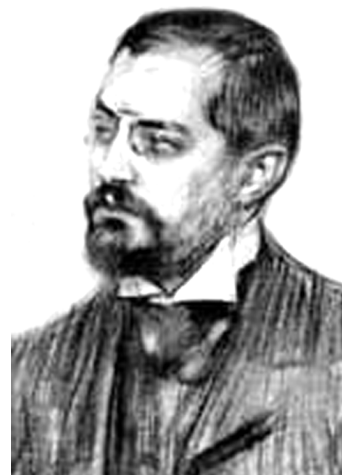
Josep Puig i Cadafalch

A l'inici dels anys vint, les tensions socials encara s'agreujaren amb la intransigència dels patrons, que davant la pressió obrera optaren sovint pel locaut (tancament de les indústries que privava els treballadors de la feina), organitzaren sindicats d'esquirols, els sindicats grocs, i grups armats de pistolers al seu servei. Entre el 1918 i el 1923 es produïren centenars d'atemptats amb morts d'ambdós bàndols. D'altra banda, els afers de la guerra colonial empitjoraven: el 1921, en el desastre d'Annual hi hagué milers de baixes.