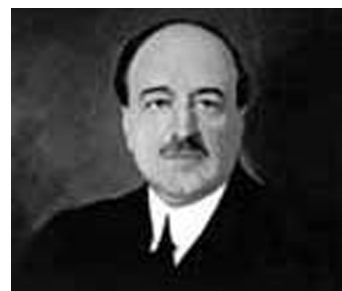
Vicente Blasco Ibáñez

L'ideari blasquista s'assembla força al de Lerroux i és un aiguabarreig confús de republicanisme jacobí, anticlericalisme, cosmopolitisme espanyolista, afirmació local i alhora menyspreu dels particularismes culturals.