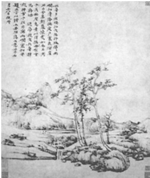
Ni Zan, Rierols tranquils i pins a l'hivern

Una part significativa de les 171 obres de teatre Yuan que han sobreviscut tenen temes basats en materials anteriors: el matrimoni de la princesa Wang Zhaojun amb un xiongnu; el viatge de Xuanzang a l'Índia per anar a buscar la llei, les maquinacions de Zhuge Liang durant els Tres Regnes, el drama dels amors i la mort de Yang Guifei, la concubina imperial.