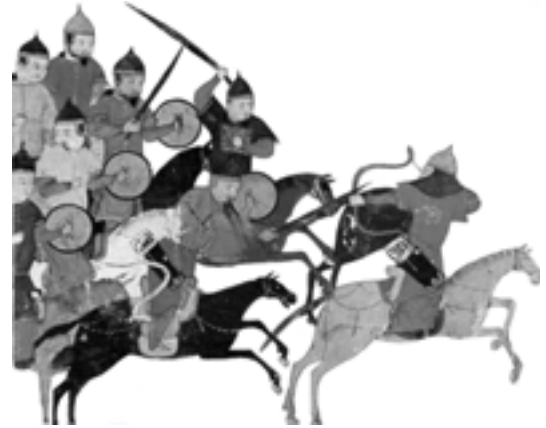
Cavalleria mongola en combat. Miniatura persa del segle XIV

La possibilitat de mobilitzar una enorme força de cavalleria a l'Àsia existia ja des del primer mil·lenni aC. però les formes eren diferenciades i depenien en gran part dels mitjans tecnològics dels pobles: al segle II aC., els xiongnu, que encara desconeixien els estreps, havien amenaçat de forma recurrent l'imperi Han, mentre els turcs, afermats pels estreps i amb arcs molt més poderosos, havien estat la gran amenaça a partir del segle VI. Els mongols apareixen a la història molt més ben armats que el turcs: amb armadura, casc i cavalls protegits amb cuir o metall, tenen una clara superioritat sobre els altres pobles de l'estepa. Però l'essencial dels mongols va ser la seva reestructuració sociològica, que va introduir la disciplina a l'estepa. Aquest estat de les estepes –que va començar a sorgir amb els qidan al segle X– es va consolidar amb els mongols i va permetre una agressió sostinguda.