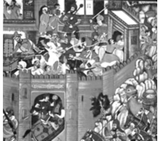
Gengis Khan conquerint una ciutat.

d'ingressos més constant que arreplegar botins. Les fonts deixen constància del fet que Gengis va intentar en alguna ocasió negociar una pau que garantís expressament el fluir comercial. Les rutes de comerç formaven ja aleshores un teixit espès que lliscava des de la Xina fins els grans centres de l'Àsia central, l'Índia i Pèrsia: a la llarga, les conquestes de Gengis cobriran exactament aquest teixit; a la curta, començarà la seva expansió pel punt que cobria el tram essencial de la ruta, el regne dels Xixia.