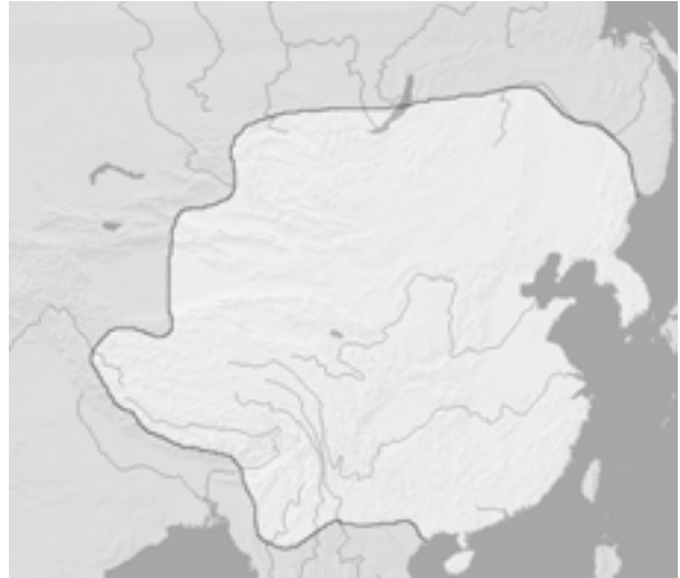
L'extensió de la Xina dels Yuan

Tot i que en molts aspectes Kubilai va mirar de comportar-se com un emperador xinès, la dinastia mongol no va acabar de tenir mai la consistència i estabilitat d'una veritable dinastia xinesa. Kubilai va restablir l'estructura de secretariat i sis ministeris que havien implantat els Tang i va preservar també la divisió entre governadors civils, militars i censors: la solidesa de l'edifici ideat pels Tang és aquí evident i més si tenim en compte que aquesta estructura administrativa va durar des dels Tang fins a principis del segle XX.