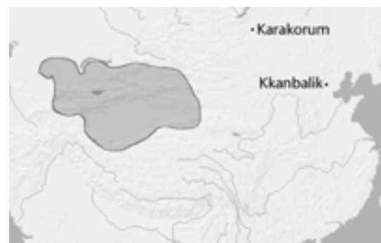
El regne dels Kara-khitai a l'Àsia central

A principis del segle XIII ja havia aconseguit imposar-se a tothom, fins i tot als llunyans naiman que vivien molt més cap a occident i que, profundament influïts pel nestorianisme i utilitzant l'escriptura uigur, eren la tribu més civilitzada de l'estepa. La victòria va ser fàcil, però tindria repercussions importants en la trajectòria del futur gran Khan: el rei dels naiman, que va fugir i va usurpar el