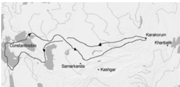
El viatge de Guillem de Rubruck a l'imperi Mongol

Changchun va assenyalar la presència d'artesans xinesos a Mongòlia Exterior i també a la regió de Samarcanda.