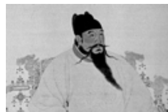
Retrat de l'emperador Yongle

La dinastia Ming no va ser capaç, però, de promoure els sectors més vitals del creixement econòmic: la seva era essencialment una visió agrícola i en aquesta no hi entrava el comerç exterior i no hi era rellevant el desenvolupament industrial. És també per això que la dinastia va ser incapaç de generar una política monetària efectiva. El paper moneda, que Hongwu havia produït generosament, va provocar una inflació monetària tan important que a la llarga va perdre tot el seu valor i es va haver d'abandonar. La Xina, que l'havia inventat, va oblidar del tot el paper moneda, per redescobrir-lo al segle XIX en mans dels europeus. Les monedes de coure van tornar a circular, però com que no n'hi havia prou, els Ming van utilitzar plata sense encunyar. Amb Yongle es van posar en funcionament moltes mines de plata, però part d'aquesta plata se la quedaven els contrabandistes i els funcionaris corruptes, i al govern n'hi arribava molta menys de la s'ex-