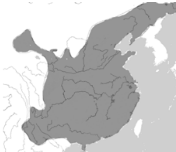
L'extensió de la dinastia Ming

Els tibetans van seguir sent un problema al llarg del seu regnat i successives campanyes xineses al 1377 i 1379 van acabar amb la mort o captura de desenes de milers de tibetans i amb la captura d'ingents quantitats de bestiar a la Xina. Als anys 80, la nova dinastia va aconseguir implantar-se definitivament al Yunnan –on tropes mongols i una proporció considerable de turcs i musulmans (duts pels mongols a aquesta regió) governaven sobre una població essencialment no xinesa-, i va reagrupar les àrees marginals que quedaven entre Yunnan i Guangxi en la nova província de Guizhou.