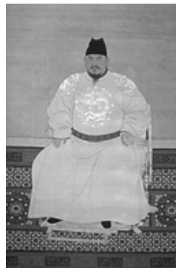
Retrat de l'emperador Hongwu

En això, com en molts elements de l'estat Ming, la influència mongol és visible: Zhu Yuanzhang volia restaurar les glòries dels Tang –el 1368 i el 1390 va