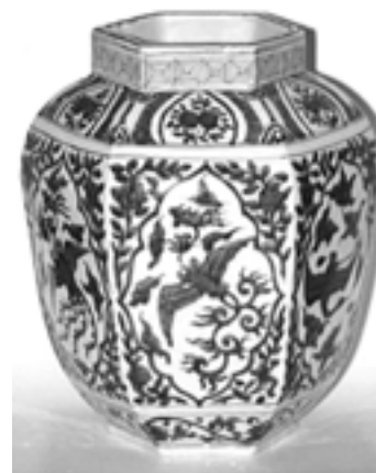
Ceràmica blanc i blava de la dinastia Ming

En política exterior , Xuande va prendre la decisió de retirar-se d'Annam, després de dues dècades d'ocupació i guerra continuada. Pels xinesos això va representar una humiliació, però també el final d'una greu càrrega financera i militar. Els vietnamites no oblidarien mai aquells 20 anys, que van generar una perdurable hostilitat cap al seu veí xinès. Pel que fa al sud-est d'Àsia, tot i que va mantenir expressament la prohibició tant al comerç exterior com a l'establiment de colònies xineses fora de la Xina, Xuande va ordenar el darrer dels grans viatges marítims: és possible que volgués compensar amb aquesta exhibició de poder per tot el sud-est d'Àsia la humiliant retirada d'Annam. Malgrat aquesta expedició, però, el regne de Xuande marca el final de la presència xi-