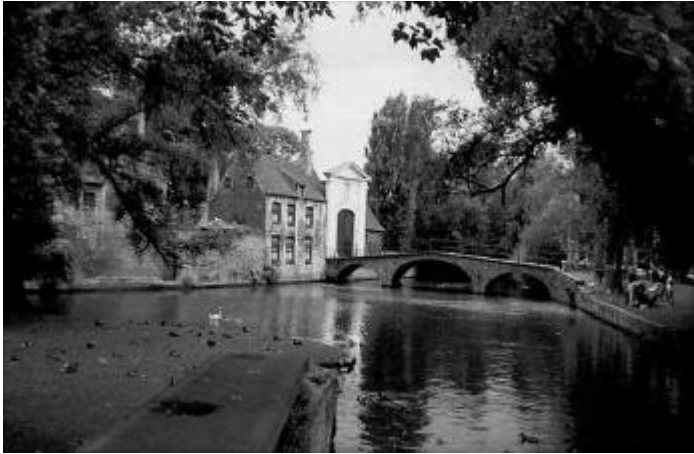
Exterior del beguinatge de Bruges

Una exemple de les representants de les nostres beguines.