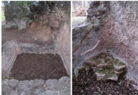
Els balnea de l'Espelt amb el tepidarium a primer terme, des de l'interior del frigidarium i piscina d'aigua freda. Piscina petita o alveus i detall de terra sobrealçat i restes d' opus signinum impermeabilitzant (imatges inferiors)