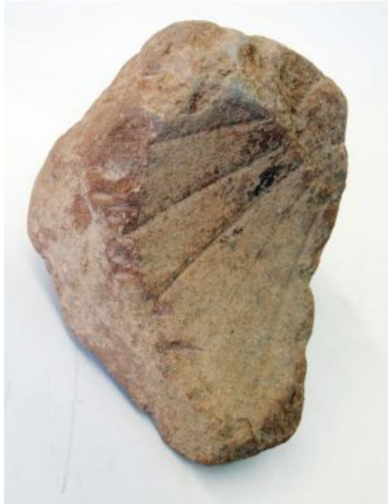
Fragment de scaphe o hemiciclum de l'Espelt corresponent a les hores postmeridieum