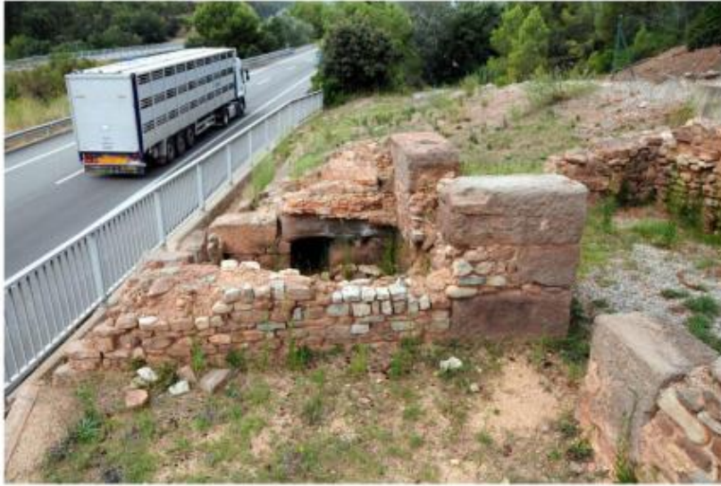
Imatge del conjunt dels balnea de Sant Amanç des del frigidarium . Aprecieu com la carretera ha fet desaparèixer l'estança del tepidarium