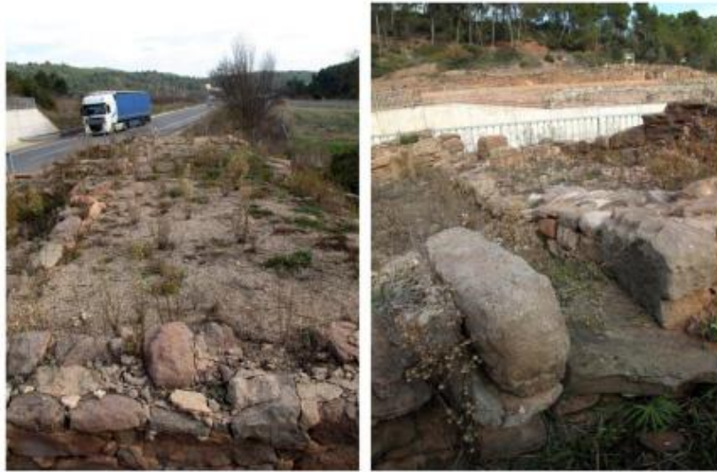
Instal·lacions vinàries altimperials amb el gran lacus i les canalitzacions de decantació i recollida del most de la vil·la de Sant Amanç de Viladés