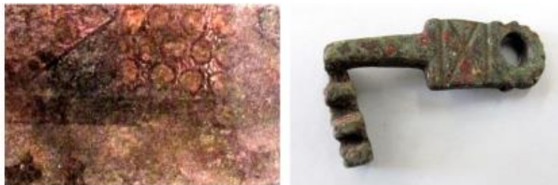
Esquerra: Decoració pictòrica mural del corredor d'entrada ( fauces ). Dreta: Clau d'una porta