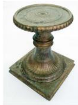
Esquerra: Fotografia del mosaic d' opus tessellatum de l'Espelt feta poc després de la descoberta l'any 1964. Dreta: Peanya de bronze amb incrustacions d'esmalt i de plata, possiblement reutilitzada com a canelobre per les restes de cera localitzades en l'interior del peu (Museu de l' Pell i Comarcal de l'Anoia)