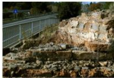
Part dels balnea de Sant Amanç de Viladés corresponent al caldarium i a l' exaedra que vehiculava l'aire calent procedent del prae-furnium