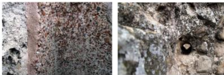
Detall de l' opus signinum que impermeabilitza les parets del lacus i d'un dels forats practicats en els murs possiblement corresponent al sistema de subjecció de la premsa de biga