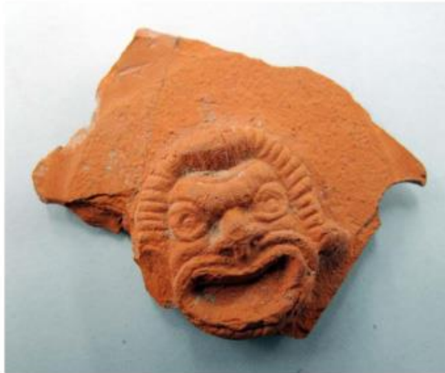
Fragment de llàntia localitzada a l'Espelt amb una màscara teatral a semblança de les representacions bàquiques. (Museu de la Pell d'Igualada i Comarcal de l'Anoia)