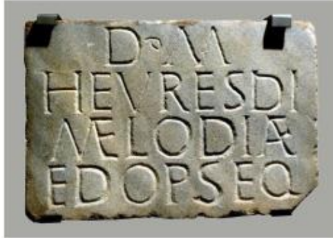
Làpida de Sant Amanç amb el nom d'Heuresis Melodia. (Museu Episcopal de Vic. Foto: Gabriel Salvans)