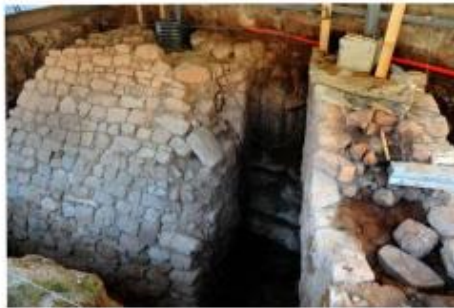
Fragment de la muralla ibèrica corresponent a l'escarpa del segle VI aC localitzada l'any 2013 sota la plaça del santuari de la Verge del Portal