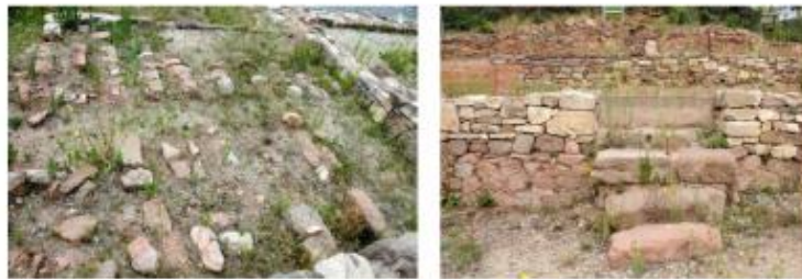
Restes de l'hipogeu de les reformes baiximperials i escala d'accés a les estances nobles