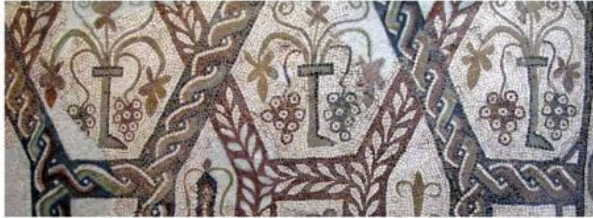
Fragment del mosaic del triclinium de Sant Amanç de Viladés amb les florerres d'on surten set sarments, dos dels quals sense res, tres rematats per una fulla de parra cada un i dos acabats en sengles gotims de raïm en una al·legoria del cicle vital del cep. (Museu Comarcal de Manresa)