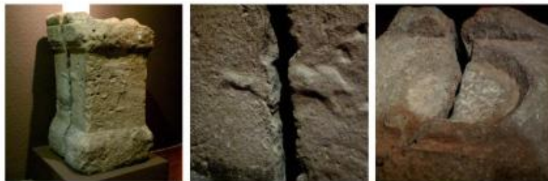
Ara dedicada a la deessa Diana localitzada a Sant Joan de Vilatorrada. Observeu la part superior amb el reblaniment en forma de bol on es feien les libacions i s'ofrenaven els presents. (Museu Comarcal de Manresa)