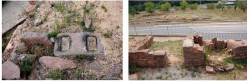
Base de pedra on probablement descansaven els eixos verticals del torculum i restes de les estances vinàries de Sant Amanç afectades pel traçat de l'eix Transversal