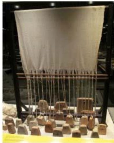
Pondera i agulles d'os de Boades (Museu Comarcal de Manresa) i reproducció d'un teler mostrat al Museu de Badalona