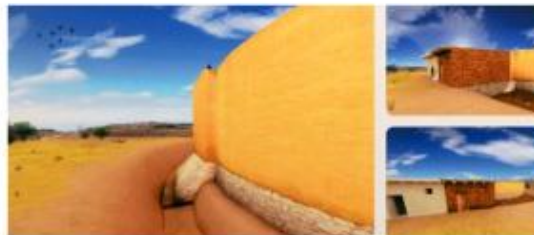
Idealització del tram de muralla excavat i l'evolució urbana de l'espai amb el creixement fora muralles. Observeu el fragment corresponent a l'escarpa de la muralla (Exposició: "Segarra-Sigarra. Cruïlla entre Ibèria i Hispània". Museu de la Pell d'Igualada i Comarcal de l'Anoia)