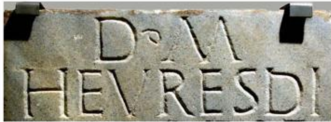
Invocació als déus Manes que encapçala la làpida de Sant Amanç de Viladés (Museu Episcopal de Vic. Foto: Gabriel Salvans)