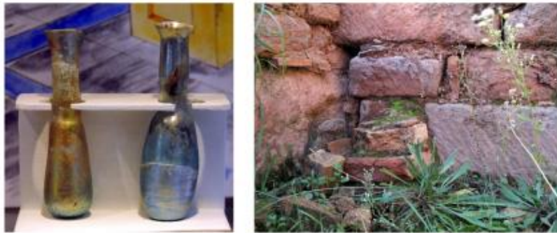
Ungüentaris del Municipium Sigarrensis (Museu municipal Josep Castellà Real). Detall de restes del sistema d'hipocaust corresponent al caldarium de Sant Amanç de Viladés