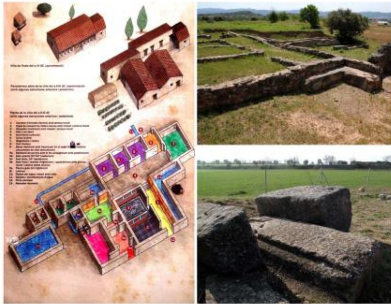
Esquerra: Planta de la vil·la del s. II-III dC. Dreta: Imatges dels murs amb la piscina gran del frigidarium a primer terme (foto superior) i dels carreus de la portalada (foto inferior)