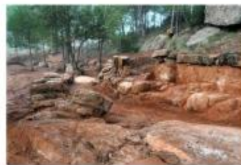
L'iter de Monistrollet. Observeu que sobre seu passa el nou eix Diagonal