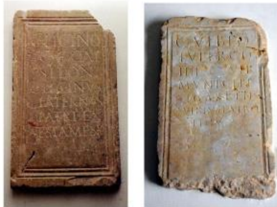
Esquerra: Estela promoguda per Gai Licini. Dreta: Estela on s'esmenta el Municipium Sigarrensis