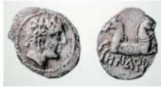
Moneda de finals del s. III aC amb la inscripció Sigara trobada a prop dels Prats de Rei