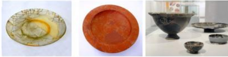
Plats de vidre i de ceràmica de l'Espelt (esquerra) i crater (dreta) usat per a barrejar el vi i l'aigua que imita un atuell àtic de bronze amb nanses. Exposició "Segarra-Sigarra. Cruïlla entre Iberia i Hispània". (Museu de la Pell d'Igualada i Comarcal de l'Anoia)