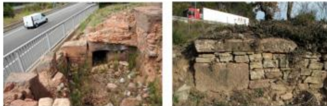
El caldarium altimperial i estances del balneum escapçades pel traçat de la carretera. Els blocs de pedra de la vil·la romana forneixen moltes parets de vinya de la zona