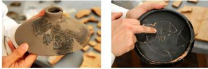
Ceràmica grega importada, segles V i IV aC, trobada en el fossat de la muralla ibèrica