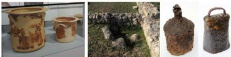
Càlats ibers de diverses mides possiblement destinats a contenir mel. Exposició "Segarra-Sigarra. Cruïlla entre Iberia i Hispània". (Museu de la Pell d'Igualada i Comarcal de l'Anoia). Llar de foc situada en el conjunt dels cubicula de l'Espelt i garrafó metàl·lic i esquila