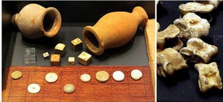
Daus i ossets o astràgals de l'exposició permanent del Museu de Badalona