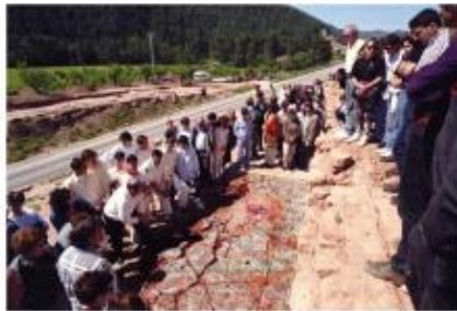
Visita al mosaic de Sant Amanç poc després de la descoberta