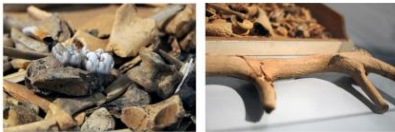
Restes òssies d'animals utilitzats com aliment o per a sacrifici. Observeu (esquerra) les peces dentals o un astragalos i (dreta) una cornamenta de cèrvol. (Jaciment dels Prats de Rei). Aquest registre coincideix amb el llistat del femer de l'Espelt