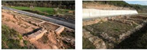
La pars urbana i la pars rustica avui dividides pel traçat de l'eix Transversal