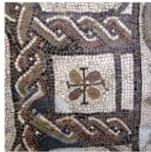
Imatges general i de detall del mosaic d' opus tessellatum corresponent a l'estança del triclinium de Sant Amanç de Viladès