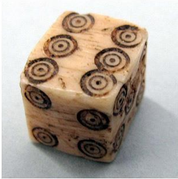
El dau de l'Espelt; és fet d'os. Museu de la Pell i Comarcal de l'Anoia