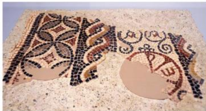
El mosaic paleocristià dels Prats de Rei amb restes del crismó un cop restaurat. (Exposició: "Segarra-Sigarra, Cruïlla entre Ibèria i Hispània". Museu de la Pell d'Igualada i Comarcal de l'Anoia)