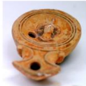
Llàntia amb cap de la deessa Diana amb la mitja lluna fent-li de corona per indicar el seu caràcter diví procedent de la vil·la de Boades (Museu Comarcal de Manresa)