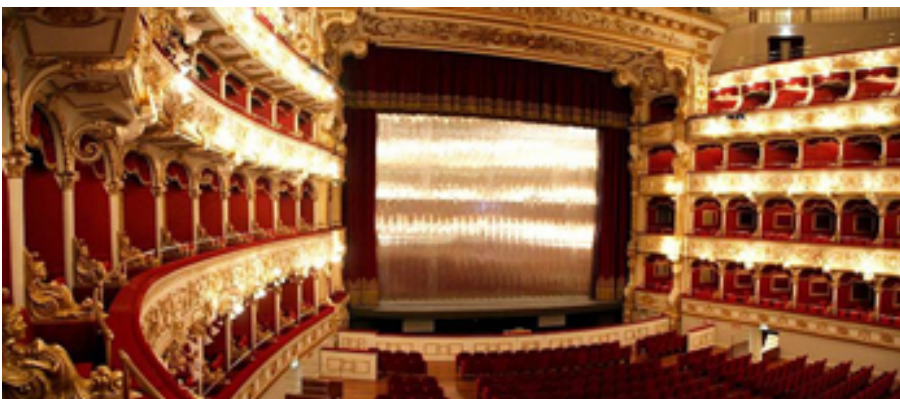
Teatre Petruzzelli. Itàlia

Aquests teatres presenten peces de gran format i, per tant, aquesta disposició facilita les dificultats que comporta la creació, el suport i la mobilitat dels elements escenogràfics i tècnics.