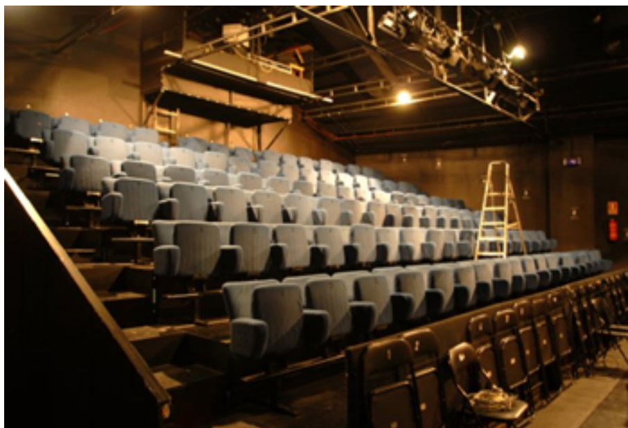
Teatre Pradillo, Madrid

L'Institut de Cultura de Barcelona (ICUB) decideix rehabilitar una sèrie d'espais de la ciutat que estan en desús, per a destinar-los a laboratoris de creació audiovisual, escènica, música i pensament. En el pla estratègic del 2006 es presenta la Xarxa de Fàbriques per a la Creació.