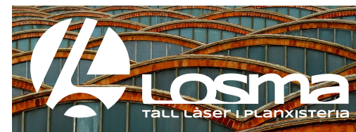
FONS FOTOGRÀFIC COLOR FOSC