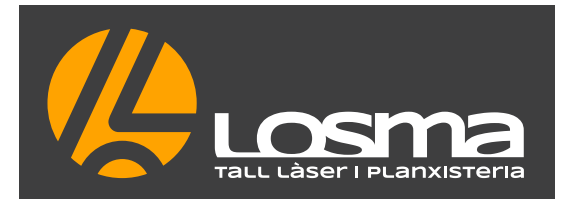
VERSIÓ PRINCIPAL FONTS FOSC