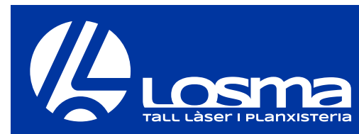
COLOR NO CORPORATIU FOSC