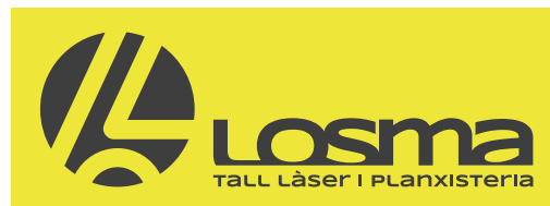
COLOR NO CORPORATIU CLAR