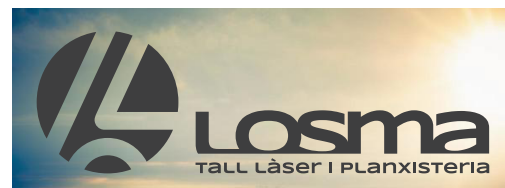
FONS FOTOGRÀFIC COLOR CLAR