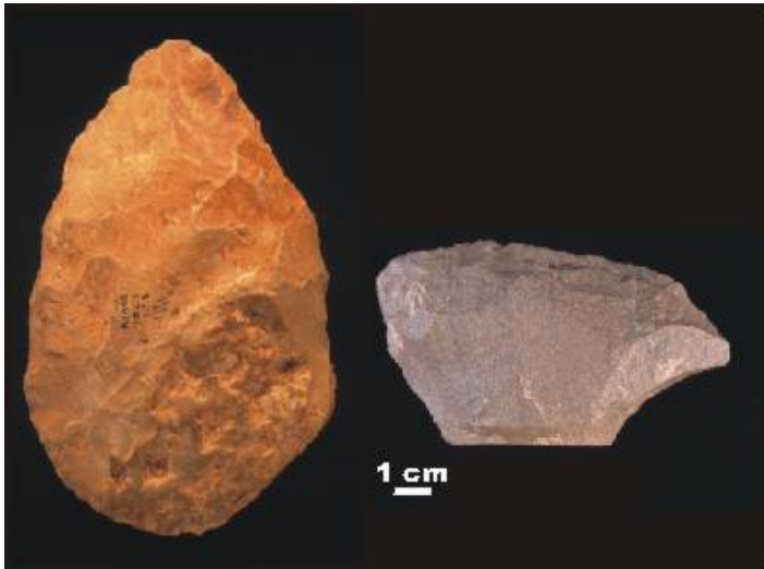
“Bifaz de sílex, nivel TG10 y raedera de cuarcita del nivel TG10”

“La mayoría de los instrumentos de Modo 2 de Galería están relacionados con niveles de ocupación de corta duración dedicados al aprovechamiento de cérvidos, équidos y bóvidos.”