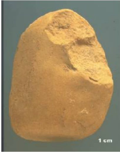
“Canto trabajado de caliza del nivel TD6 del yacimiento de Gran Dolina”

“Es el modo técnico de fabricación de instrumentos más antiguo. Denominado también como "olduvayense" por el yacimiento epónimo de Olduvai en África, ha sido descrito en otros yacimientos y se remonta hasta aproximadamente 2,5 m.a. Las herramientas de piedra más antiguas aparecidas en los yacimientos de la Sierra de Atapuerca tienen alrededor de 1 m.a. y han aparecido en el nivel TDW4 del yacimiento de Gran Dolina. Herramientas de Modo 1 las encontramos también en los niveles TD5 y TD6 del mismo yacimiento. Las documentadas en el último nivel se encuentran asociadas a los restos de Homo antecessor.”