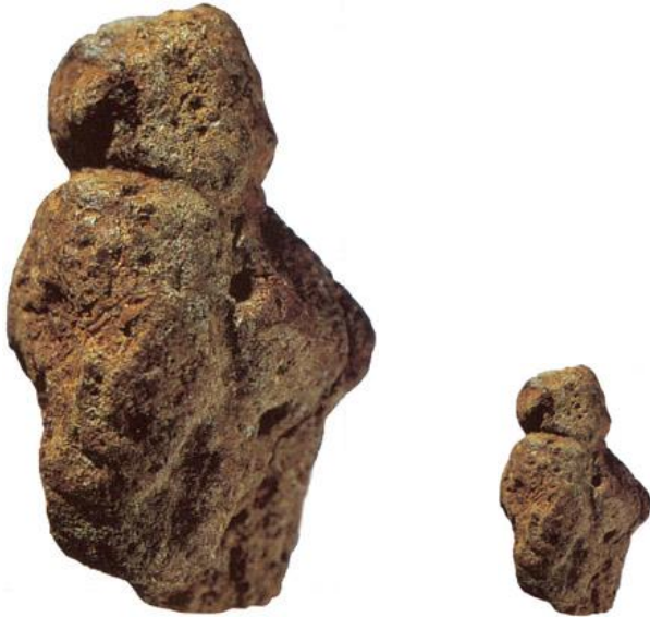
Figura de Berekhat Ram

els autors 24 és una representació figurativa antropomorfa similar, pel que fa a la simbologia, a les del paleolític superior anomenades Venus, però amb 200.000 anys més que totes les altres conegudes. Les incisions descrites separen dos volums: el superior correspon al cap, i l'inferior al cos, i reprodueix, en conjunt, una imatge humana 25