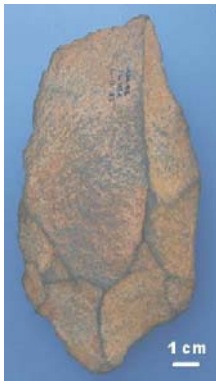
“Hendedor de arenisca, nivel TG10 del yacimiento de Trinchera Galería”

“El Modo 2 de configuración de instrumentos es también conocido como "Achelense", haciendo referencia al yacimiento de Saint Acheul en Francia. En la Sierra de Atapuerca ha sido documentado en el yacimiento de Trinchera Galería. Este modo técnico aparece por primera vez en Africa hace aproximadamente 1,5 m.a. y se prolonga hasta hace unos 300.000 años. Comienza a observarse una planificación previa y un repertorio de herramientas mucho mayor que el encontrado en el Modo 1. Aparecen por primera vez útiles como los bifaces o los hendedores. Por otra parte es muy característica la utilización de lascas de gran tamaño que pueden utilizarse sin retocar o retocadas posteriormente.”