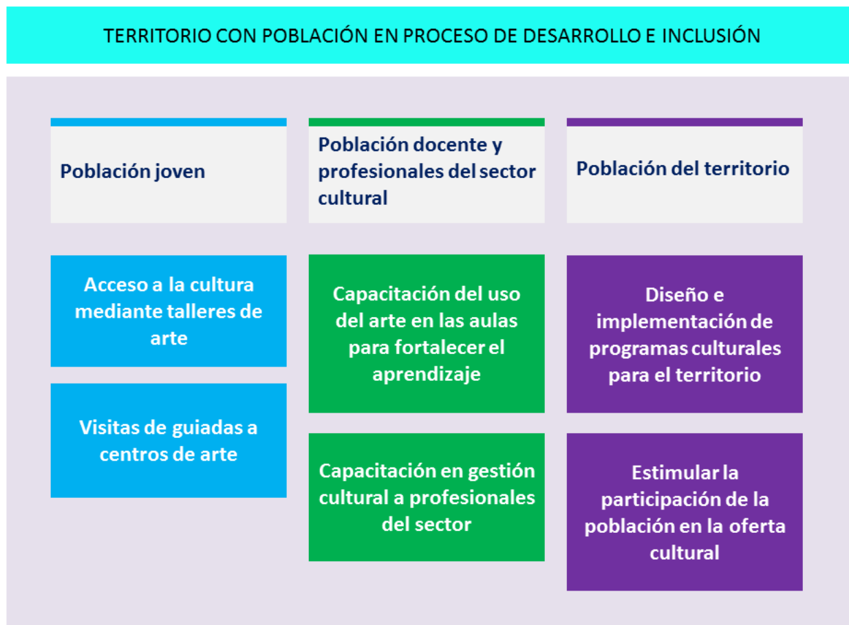
Esquema de la división de actividades por tipo de público. Elaboración propia.

económicos, sociales y culturales y dotarlos de ciertas competencias para que finalmente se culmine el proceso de desarrollo e inclusión en el que se encuentran.