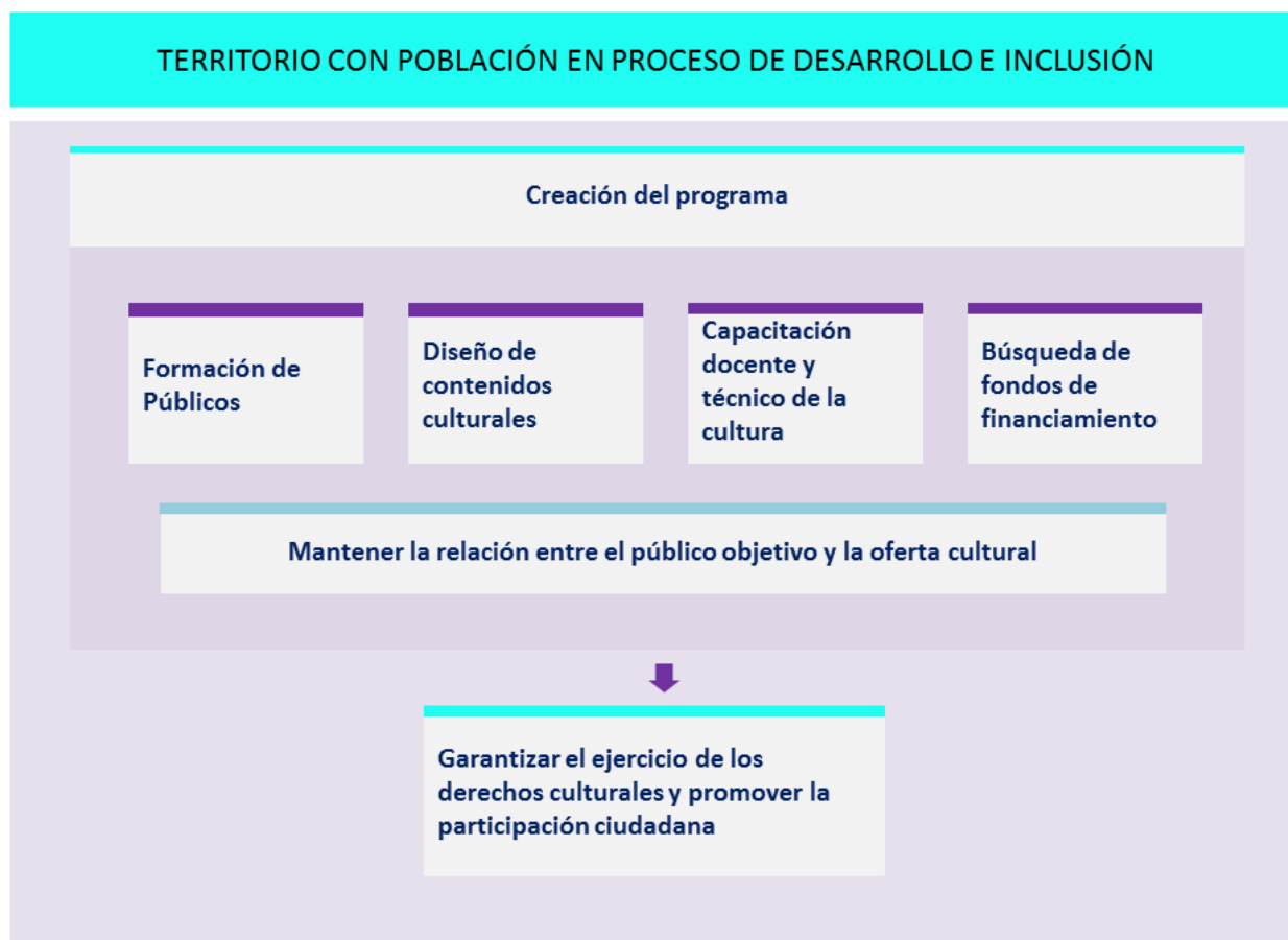
Esquema de los Objetivos del TFM. Elaboración propia.

El objetivo general de este proyecto de gestión cultural consiste en desarrollar acciones de formación de públicos y de gestión en territorios de Perú con población en proceso de desarrollo e inclusión social que garanticen el ejercicio de los derechos culturales para promover la participación ciudadana en sus poblaciones.