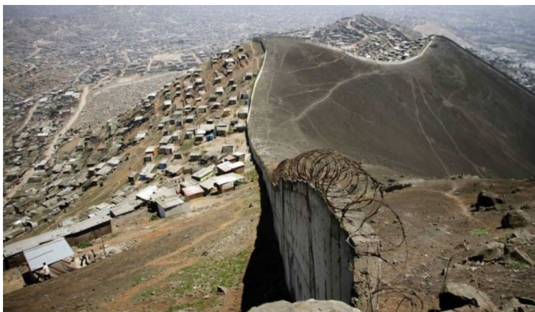
El Muro de la Vergüenza que divide San Juan de Miraflores y Las Casuarinas.

Analizando el anexo estadístico de indicadores distritales 15 , observamos que dentro de los distritos de la ciudad de Lima encontramos un porcentaje de 0% a 2% de población PEPI (175 mil personas bajo esta condición), a excepción de Santa María del Mar que presenta un 10.6% (más de 43 mil personas) de población en esta situación. Sin embargo para determinar el territorio se ha tenido en cuenta un elemento de exclusión que no aparece en estos indicadores. Se trata del muro de la vergüenza que desde el 2011 separa San Juan de Miraflores de Las Casuarinas, una de las urbanizaciones residenciales más lujosas de Perú ubicada en el distrito de Surco. Este fenómeno es testimonio material de la desigualdad y la exclusión asociada a la pobreza, vulnerabilidad y bajo desarrollo humano. Así mismo supone un símbolo compartido a nivel internacional puesto que se establece como un patrón de segregación socio espacial que se manifiesta de diferentes formas en otras ciudades de Latinoamérica. En Buenos Aires una malla de acero separa La recoleta de La Villa 31, en Río de Janeiro muros de hormigón impiden el crecimiento de las favelas, en Caracas una autopista divide el barrio pobre de Petare de una lujosa zona de viviendas o la ubicación de un exclusivo campo de golf junto al asentamiento Kennedy en Uruguay 16 .