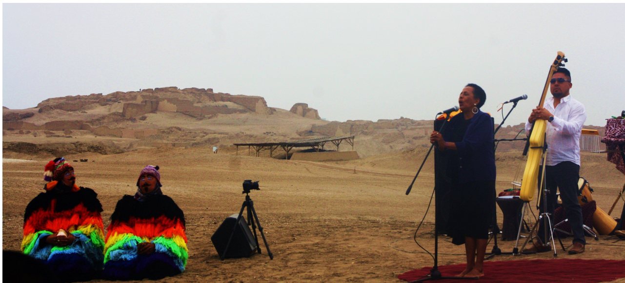
Actuación de Susana Baca en la Huaca de Pachacamac como parte de la programación de Huacas, Burbujas y Rock and Roll.