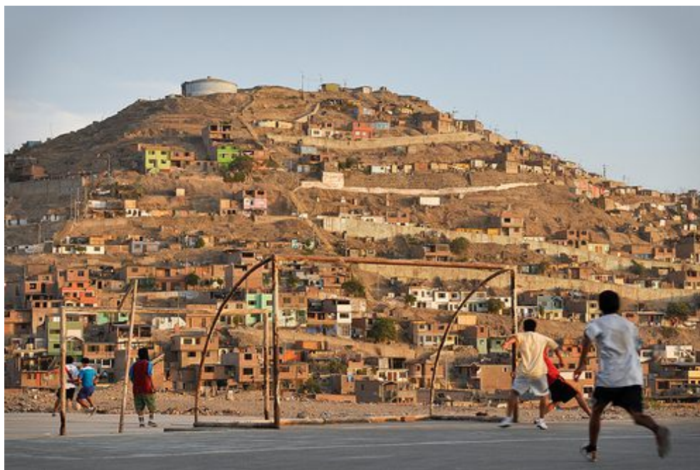
Vecinos de San Juan de Miraflores practicando deporte.

Dentro del contexto de San Juan de Miraflores es donde se plantea la puesta en marcha del presente proyecto de gestión cultural para incrementar el desarrollo socioeconómico de su población mediante una serie de actividades de formación y de gestión cuyo objetivo es dar acceso a las oportunidades y recursos necesarios para participar de la vida cultural y disfrutar de sus derechos fundamentales.