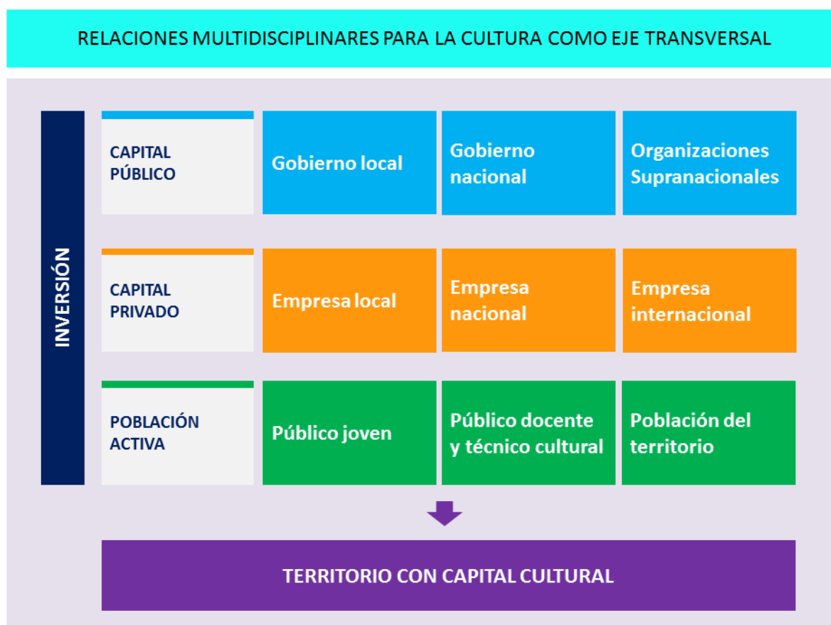
Esquema de cooperación para la cultura como un eje transversal. Elaboración propia.

Así los objetivos y actividades del proyecto de gestión cultural han de estar vinculados a todos los agentes no solo de su contexto inmediato del territorio donde se ubica. Sino que sus relaciones deben incluso abordar el panorama nacional. Con esto se consigue vincular a lo local o a la biodiversidad cultural (Baltà y Pascual, 2015) de un barrio con los lenguajes y, porque no decirlo, con los espectadores de otro entorno con la finalidad de consolidar el desarrollo y la inclusión del mayor número posible de individuos que actualmente se encuentran en situación de vulnerabilidad. Podemos decir entonces que las relaciones de esta propuesta debe ser tan multidisciplinar como lo es la interculturalidad de la sociedad peruana.