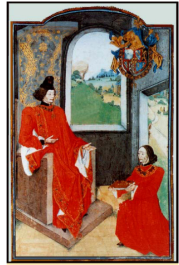
Jean Lefèvre, rey de armes Toixó d'Or, entregant els Estabuts a Felip el Bo (La Bíblia, Koninklijke Bibliotheek, Ms. 76 E 10, fol. 28r).

Felip III el Bo, duc de Borgonya (1419-1467), creador de l'anomenat ús o manneres de Borgonya , imposa unes rígides normes de cerimonial amb la intenció de convertir la seva cort en el model d'etiqueta i ordre, i sabem, per exemple, que s'hi va utilitzar per primera vegada una forquilla. Encara que la cort de Borgonya mai no va ser una primera potència política o militar de l'època, sí que va ser la més influent en cerimonial i etiqueta. Pretenia així superar en fastos altres corts europees i contrarestar el seu poder politicomilitar envoltant el sobirà d'un ritual que afirmés la seva superioritat sobre els seus súbdits, imposar una regla i un ordre rigorosos a les activitats de la cort i els palaus davant dels continus canvis de seu dels ducs, i homologar un mosaic de territoris cohesionant-los per mitjà del cerimonial. Per a això, va portar al seu servei els nobles de tots aquests territoris, i els va mantenir units amb l'Ordre del Toixó d'Or com a aliats entorn d'una causa comuna.