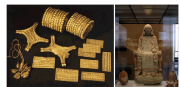
Tresor del Carambolo (segles VIII-III aC) i Dama de Baza (400 aC)

L'antiguitat a la península Ibèrica està marcada a efectes cerimonials per les diferents cultures hegemòniques que s'hi van succeir, ja que és un territori que encara no té unitat pròpia. El regne o confederació de Tartessos, cultura autòctona que sorgeix entorn de la desembocadura del Guadalquivir, va haver de tenir importants manifestacions cerimonials si ens atenim a les restes arqueològiques que ens han quedat, com el Tresor del Carambolo. La Dama de Baza és un altre dels exemples que podem citar del que devia ser el riquíssim cerimonial ibèric. Pel que fa als fenicis, cartaginesos, grecs o romans, reprodueixen a les seves colònies o assentaments a la península representacions similars a les que podem trobar en altres punts dels seus àmbits d'influència.