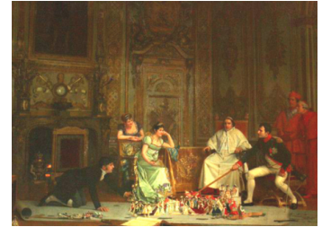
Assaig general de la coronació de Napoleó

Napoleó Bonaparte reprèn la filosofia política del Rei Sol i la materialitza en fets tan determinants com la seva autocoronació i, especialment, en el que considerem el primer text de protocol modern: el Decret de 13 juliol de 1804 (24 messidor, any XII). Aquest text dóna per primera vegada una llista de precedències de l'estat i també la definició d'honors militars, civils i fúnebres que s'han de retre a certes autoritats. Va estar en vigor fins al 1907.