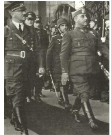
Trobada entre Hitler i Franco a Hendaia

Paral·lelament, hem de constatar que el protocol, a diferència del cerimonial, apareix en societats avançades culturalment que necessiten ordenar la presència de l'Estat en nom de la transmissió de conceptes com les seves jerarquies o la seva justícia, independentment del caràcter democràtic o totalitari de la seva estructura. Per tant, no és només la decisió del dictador de perpetuar la