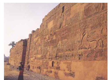
Batalla de Kadesh als murs del Palau de Karnak