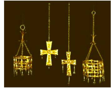
Tresor de Guarrazar i corona de Recesvint (484-711)

La magnificència de palaus com l'alhambra de Granada o l'alcàsser de Sevilla exemplifiquen aquesta tendència a la perfecció. Al seu torn, Medina al-Zahra, la ciutat palau que va manar construir Abd-al-Rahman III, constitueix un esplèndid centre cortesà regit per una rígida normativa cerimonial. Entre les visites diplomàtiques conegudes cal destacar l'ambaixada de Constantí VII a Abd-al-Rahman III (949), en la qual es pot subratllar la sorpresa dels emissaris de Bizanci –més que habituats al cerimonial i a la solemnitat– davant de l'esplendor del pompós aparell desplegat davant dels seus ulls. Ibn Jaldún ens dona notícia de les visites d'emissaris dels reis francs i alemanys, i fins i tot de la de l'emperador Otó I d'Alemanya.