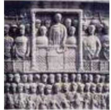
Obelisc de Teodosi

A partir de Constantí el Gran (324-337), els emperadors segueixen l'exemple oriental i s'identifiquen cada vegada més amb la divinitat alhora que assimilen la doctrina del cristianisme basada en una autoritat imposada per l'únic déu. Bizanci es converteix en la capital de l'Imperi i el lloc natural d'unes cerimònies amb una fisonomia personalista de gran influència oriental, en què l'esplendorós cerimonial cortesà tendeix a destacar el caràcter diví del basiléus per mitjà d'elements ornamentals com la túnica d'or i la diadema, o gestuals com la prokinesis o reverència.