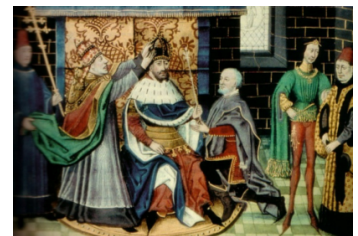
Carlemany coronat emperador (800)

Quan Carlemany arriba al poder, el regne dels francs havia de desenvolupar les seves institucions administratives, culturals i jurídiques, tot i que ni tan sols disposava d'una residència permanent, ja que els reis francs aprofitaven l'estiu per a governar els seus territoris mentre mantenien les seves campanyes militars, i durant l'hivern vivien a qualsevol dels seus palaus.