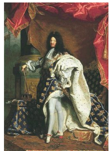
Lluís XIV (1643-1715)

Algunes fórmules de compromís arbitrades per a resoldre els freqüents conflictes de precedències són la taula rodona utilitzada al tractat d'Utrecht (1713), per a evitar les capçaleres presidencials, o la idea del marquès de Pombal (1760) d'ordenar als ambaixadors –a excepció del Nunci– per les dates de les seves acreditacions, rebutjada en el seu moment però utilitzada avui en dia. El segle XVIII confirma el respecte a jerarquies i títols, i molt especialment a les precedències.