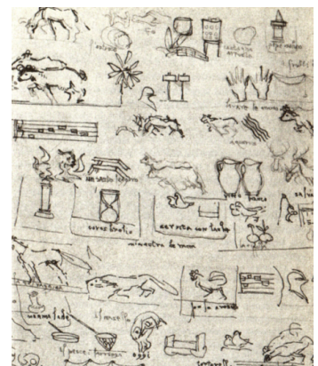
Menú dibuixat per Leonardo i Boticelli

Isabel i Ferran imprimeixen a la monarquia hispana un caràcter cortesà i palatí inexistent fins en aquell moment sobretot a causa de l'absència de cort pel caràcter transhumant d'uns sobirans en guerra i mobilitat contínues. Només l'assentament en un lloc permanent afavoreix la formació de la cort i el desen-