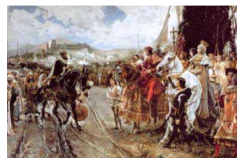
La cerimònia del lliurament de Granada (1492)

El primer contacte d'Espanya amb l'etiqueta borgonyona es va produir quan la princesa Margarida va venir per casar-se amb el príncep Joan (1474), en el banquet ofert per Felip el Formós als Reis Catòlics i a la seva esposa Joana a Toledo. La gran novetat va consistir que el menjar va ser servit segons els cànons del cerimonial borgonyó, de ritme cadenciós i reglamentat fins al detall més mínim, amb un servidor per a cada comensal per al menjar i la beguda, fet que va produir gran impressió als castellans, acostumats a menjar entre tumults, soroll i desordre.