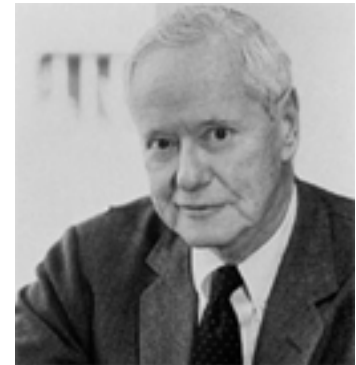
Robert K. Merton

En la cultura nord-americana s'emfatitzen fortament l'èxit i el triomf econòmic com a valors socials: l'ambició es converteix en un objectiu molt subratllat. El valor de l'èxit és tan central i persuasiu que els individus de tots els orígens socials l'assumeixen com a propi. No obstant això, no tothom té accés als mitjans per a aconseguir l'èxit. Mentre que l'ambició és gratuïta per a tothom, els mitjans legítims i institucionals per a satisfer-la no ho són. No hi ha bones feines per a tothom, l'educació exigeix qualitats personals específiques, els diners són escassos per a la majoria de la gent. La societat està organitzada de tal manera que els membres de les classes més baixes tenen moltes menys oportunitats d'aconseguir l'èxit tal com el defineix la cultura general.