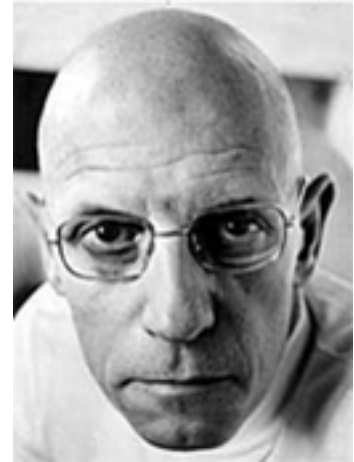
Michel Foucault

El 1975 Michel Foucault publica Vigilar i castigar , treball que, malgrat seguir una estratègia intel·lectual certament heterodoxa i desordenada, ha tingut certa influència en la comprensió actual dels mètodes de control social organitzats. Foucault es comença preguntant com és possible que els mètodes de càstig premoderns es transformessin tan ràpidament en la racionalitzada estructura carcerària de l'actualitat. Denomina tecnologies del càstig els sistemes de vigilància i càstig propis de cada societat.