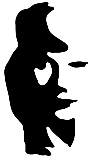
Home tocant el saxo o cara de dona?