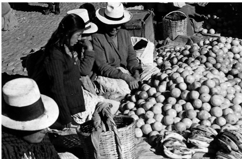
Mercat indígena al Perú

A l' Amèrica hispànica va passar al contrari. L'aparell estatal va intentar dirigir tot el desenvolupament de l'economia , va mirar de controlar totes les iniciatives i va afavorir la substitució de criteris econòmics per criteris polítics en el desenvolupament de les noves colònies. El diferent entramat institucional explicaria l'evolució tan divergent experimentada pels països americans amb situacions de partida i estructures materials tan semblants.