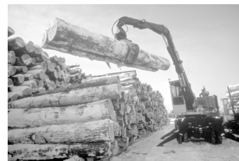
La selva amazònica, indret ric en recursos naturals.