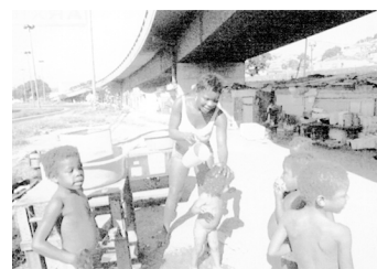
Nens que viuen en condicions pèssimes en un barri suburbà de Rio de Janeiro.

D.C. North (1990). Institutions, Institutional Change and Economic Performance . Cambridge: Cambridge University.