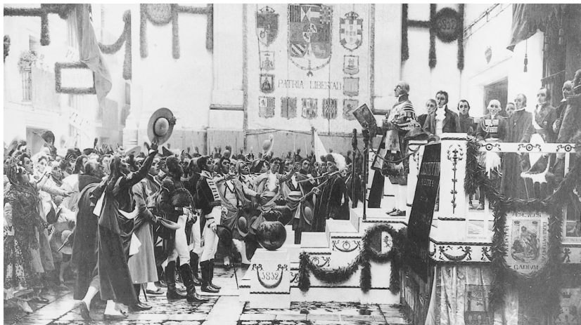
Promulgació de la Constitució de Cadis segons el quadre de Salvador Viniegra.

L'estudi de les institucions és i ha estat un dels objectius principals de les ciències socials, molt especialment de la ciència política. De fet, els primers estudis endegats per part d'aquesta disciplina –desenvolupats al segle passat– tenien per objecte quasi exclusiu la comparació entre els sistemes constitucionals de diferents països com a mitjà per aconseguir descobrir quin d'ells era el que proporcionava uns avantatges més grans, entenent generalment per aquest darrer concepte més estabilitat i eficiència del sistema.