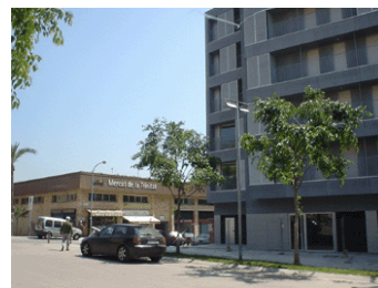
Habitatges i equipaments del barri de Trinitat Nova

En resum, el 1996 a Trinitat Nova calia remodelar bona part dels habitatges, promoure activitats i serveis econòmics i productius, connectar el barri amb l'entorn i crear nous equipaments d'atracció supralocal.