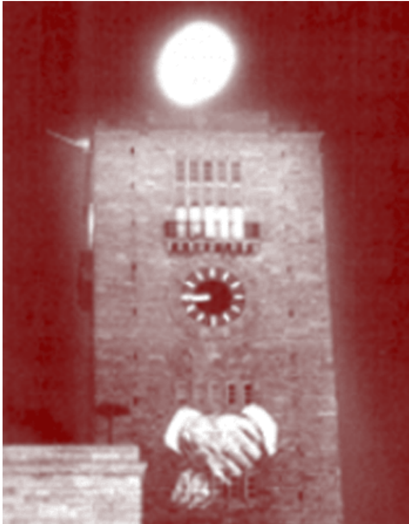
Imatge d'una "projecció monumental" (Berna, 1985)

Wodiczko ha presentat projeccions públiques al New York City Department of Public Affairs Building, Columbus Circle, a Nova York (1999); al Bunker Hill Monument, Boston, a Massachusetts (1998); en el monument a Lenin, a Leninplatz, al Berlín Oriental (1990); al San Diego Museum of Man i al Centro Cultural Tijuana (1998); i al Guildhall, Derry, a Irlanda del Nord (1985).