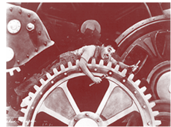
Temps moderns, 1936