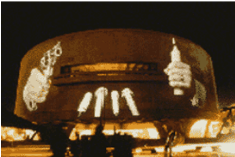
Imatge d'una "projecció monumental" (Washington, DC, 1988)