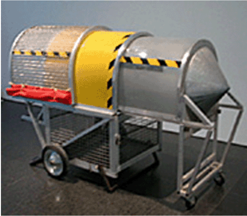
Imatge del "homeless vehicle" (Nova York, 1988)