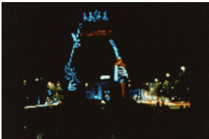
Imatge d'una "projecció monumental" (Madrid, 1991)

En una obra del 1991, per exemple, va projectar la imatge d'un comprador adquirint mercaderia al mercat negre a Varsòvia, figura bastant habitual en el Berlín d'aleshores, sobre el monument dedicat a Lenin a Berlín. El 1985, sense autorització, va projectar una esvàstica sobre la façana de la South Africa House, a Trafalgar Square, Londres. La peça va ser suspesa al cap de dues hores a petició de les autoritats de Sud-àfrica, que posteriorment van presentar una protesta oficial davant del Govern del Canadà, país de ciutadania de Wodiczko. En una altra projecció pública a Madrid, sobre l'Arc de la Victoria, el gener del 1991, durant la Guerra del Golf, va intercalar la imatge d'un parell de mans d'esquelet; l'una sostenia un rifle M-16 i l'altra, un sortidor de gasolina, i en tots dos costats s'hi llegia "Quants?".