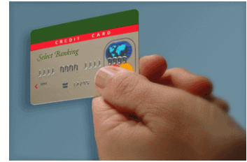
Targeta de crèdit amb xip

Disposar del personal més i millor preparat i, també, de la tecnologia d'última generació en matèria de tecnologies d'informació i comunicacions, és una meta difícil d'assolir, sobretot si les empreses tenen la certesa que aquests elements pesen molt en el circuit comercial i laboral.