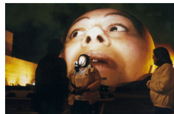
Imatge d'una "projecció monumental" (Tijuana, 2001)