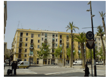
Rambla de Poblenou