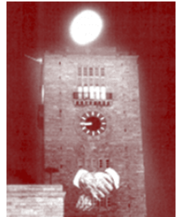
Imagen de una proyección monumental (Berna, 1985)

En este contexto de hiperactividad de proyectos urbanos, hemos encontrado el proyecto Brasmitte , que se desarrolla desde hace años en São Paulo, en Brasil. Lo hemos descubierto siguiendo la estela de trabajos más recientes de Wodiczko.