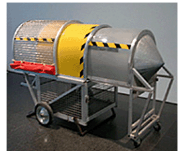
Imagen del Homeless Vehicle (Nueva York, 1988)