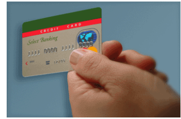
Tarjeta de crédito con chip

En vuestra ciudad, ¿hay barrios industriales? ¿Conocéis su delimitación? ¿Tenéis conocimiento de los productos o servicios que ofrecen las empresas o fábricas que hay en estos barrios? ¿Hay relación con el conocimiento?