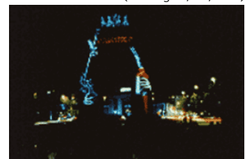
Imagen de una proyección monumental (Madrid, 1991)