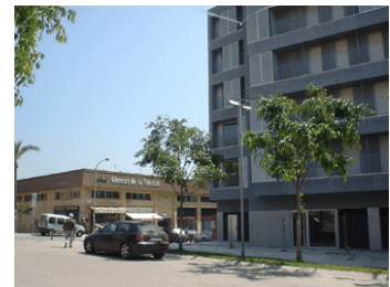
Viviendas y equipamientos del barrio de Trinitat Nova

En resumen, en 1996 en Trinitat Nova era necesario remodelar buena parte de las viviendas, promover actividades y servicios económicos y productivos, conectar el barrio con el entorno y crear nuevos equipos de atracción supralocal.