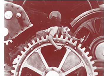
Tiempos modernos, 1936

La incorporación de la tecnología de última generación en el ámbito de la producción ha dado un gran impulso. Ya nada es como antes, el automatismo en las empresas ha constituido una reorganización de lo laboral, desde la modificación de las plantillas de empleados necesarios para seguir produciendo, sistemas alternativos de almacenamiento de información, etc., hasta la necesidad de equiparse con los artefactos que permitirán agilizar el tratamiento de una gran cantidad de información, un mayor ajuste y precisión, tanto en los objetos producidos como en los informes obtenidos; y, desde luego, la necesidad de recurrir necesariamente al ámbito del saber y del conocimiento para asegurarse un lugar en el circuito de producción.