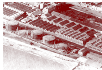
Zona industrial de Poblenou

Algunas de las iniciativas que acompañan al plan de barrio 22@ y que se relacionan directamente con la vivienda pueden traducirse de la siguiente manera: