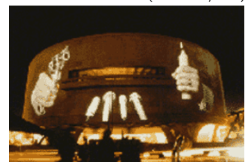
Imagen de una proyección monumental (Washington, DC, 1988)