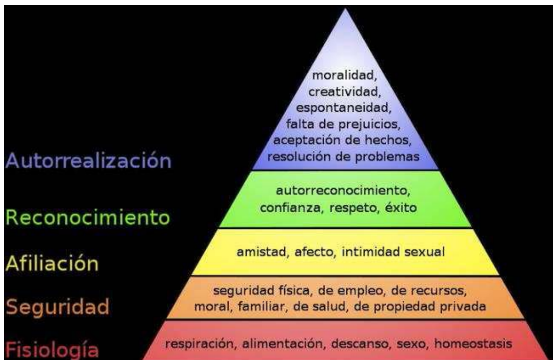
Pirámide de Maslow de las necesidades humanas

La necesidad de consumo se puede resumir como un estado de carencia. Abraham Maslow hizo una gran aportación a la teoría de la motivación con su famosa Pirámide de las necesidades humanas, En su obra Una teoría sobre la motivación humana (1943, luego ampliada), Maslow formula una jerarquía de necesidades humanas y defiende que conforme se satisfacen las necesidades más básicas, los seres humanos desarrollan necesidades y deseos más elevados, como protección y cuidado, amor, estima, información y, por último, autorrealización.