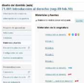
ESPACIO DE CONFIGURACIÓN AULA EQUIPO DOCENTE - MATERIALES Y FUENTES