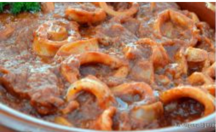
Pescados y Mariscos