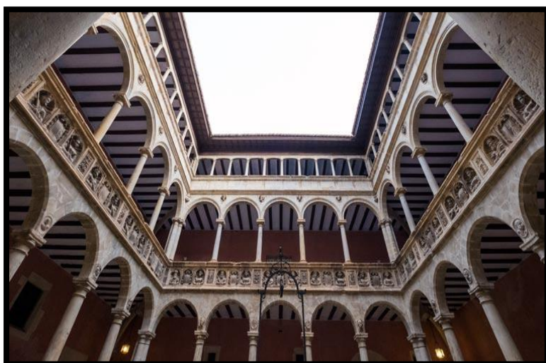
1 Pati central dels Reals Col·legis de Sant Jaume i Sant Maties, on podem veure l'arquitectura renaixentista plenament italiana, obra de l'escultor Francisco de Montehermoso. La iconografia central exalta la monarquia promotora de l'obra, Carles V i el Príncep Felip. Centre d'interpretació del Renaixement. Tortosa.

Les infraestructures culturals de nova creació foren, els Reals Col·legis de Sant Jaume i Sant Maties, també anomenat Col·legi de dalt, l'any 1544 5 . Inicialment