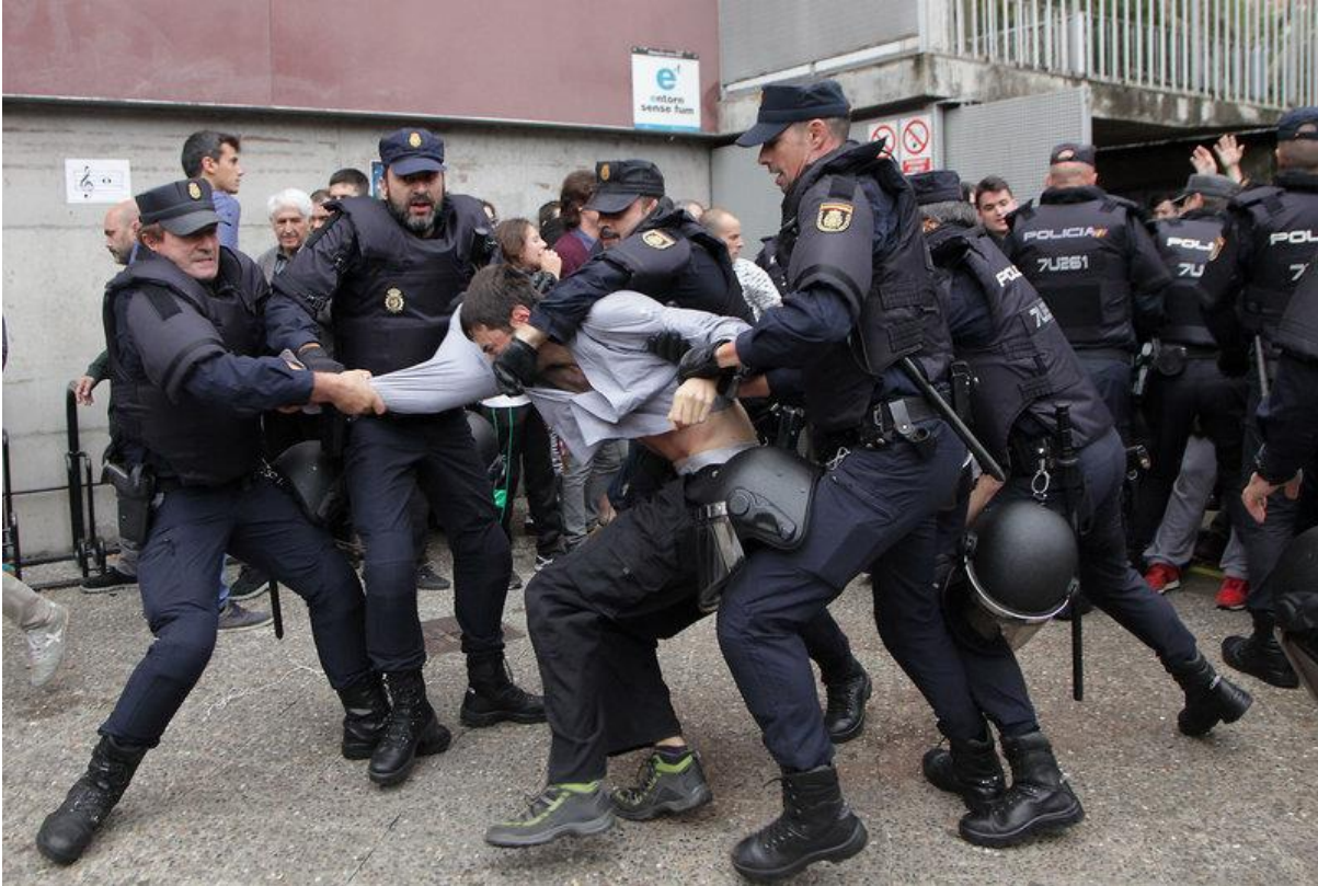
Girona. Escola Joan Bruguera. Foto: Joan Sabater