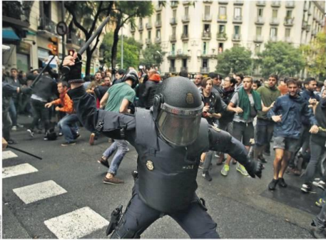
Violence broke out in Barcelona as the Catalan government held a referendum on independence. The police used force to disperse the crowd, leading to injuries and property damage.

Brussels fails to criticise Spain for violent response after hundreds of voters are injured in police clashes