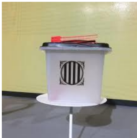
Model d'urna utilitzada pel Referèndum.

La primera gran incògnita era saber com i quan arribarien les urnes. El Govern les havia mostrat dies abans de la consulta i, malgrat que el gran desplegament policial, no se'n va interceptar cap. Així mateix, el referèndum requeria equips informàtics i comunicacions per tal de poder fer efectiva la votació. Davant la possibilitat de tancaments d'alguns col·legis, el Govern va decidir decretar el cens universal, és a dir, els electors podien anar a votar a qualsevol dels col·legis que estiguessin oberts i operatius.