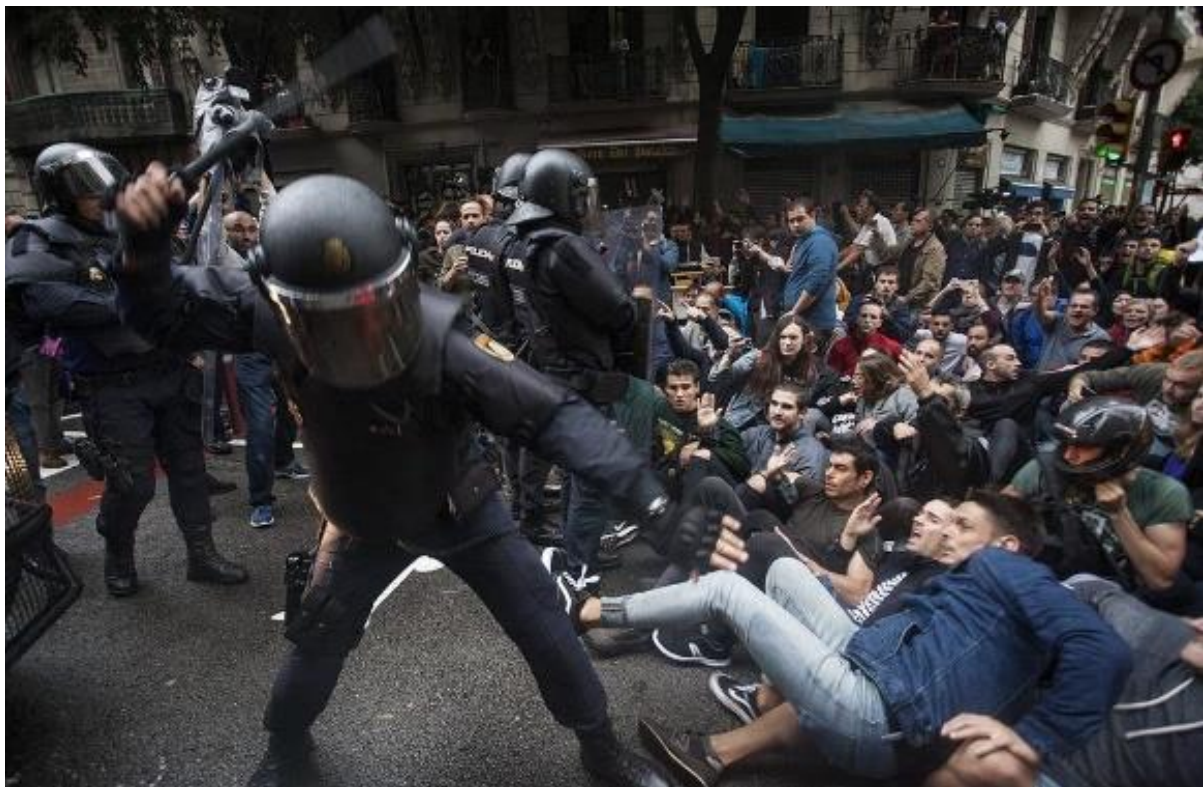
Càrrega policial cruïlla entre els carrers de Sardanya, Diputació i Ramon Llull.