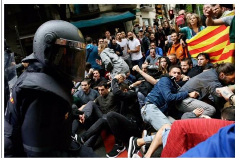
Hundreds of people were injured on a day of violent confrontation as the region voted on independence