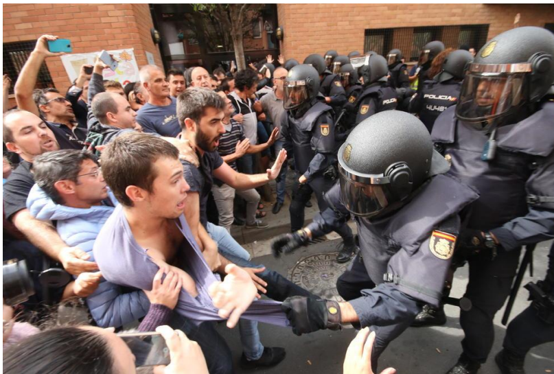
Lleida. Barri de la Mariola. Font: Segre.