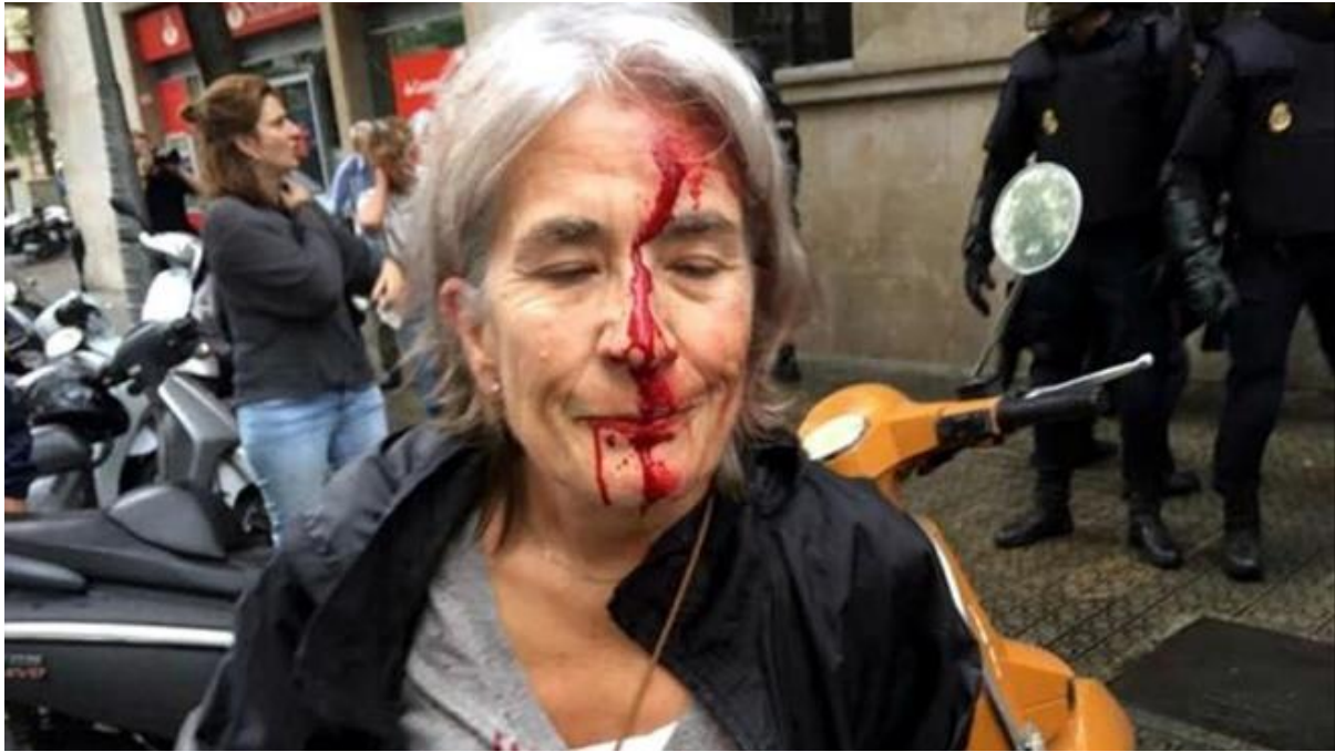
Càrrega policial davant l'escola Infant Nen Jesús de Barcelona.