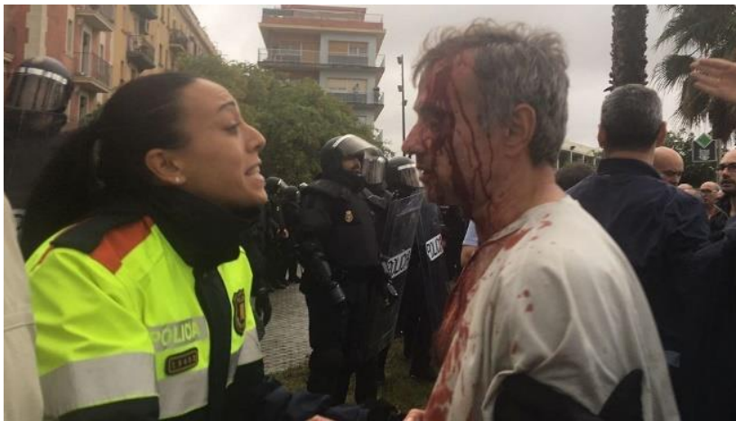
Barcelona. Escola Mediterrània.