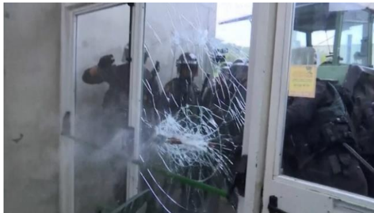
Entrada pavelló poliesportiu de Sant Julià de Ramis.