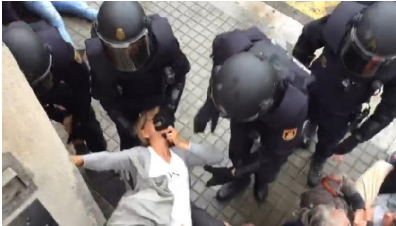
Barcelona. IES Pau Claris.