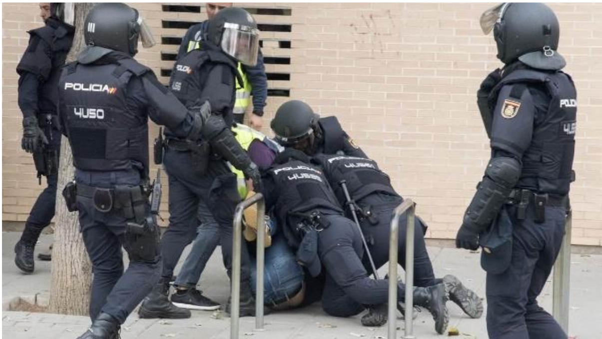
Lleida. Barri de Can Cappont.