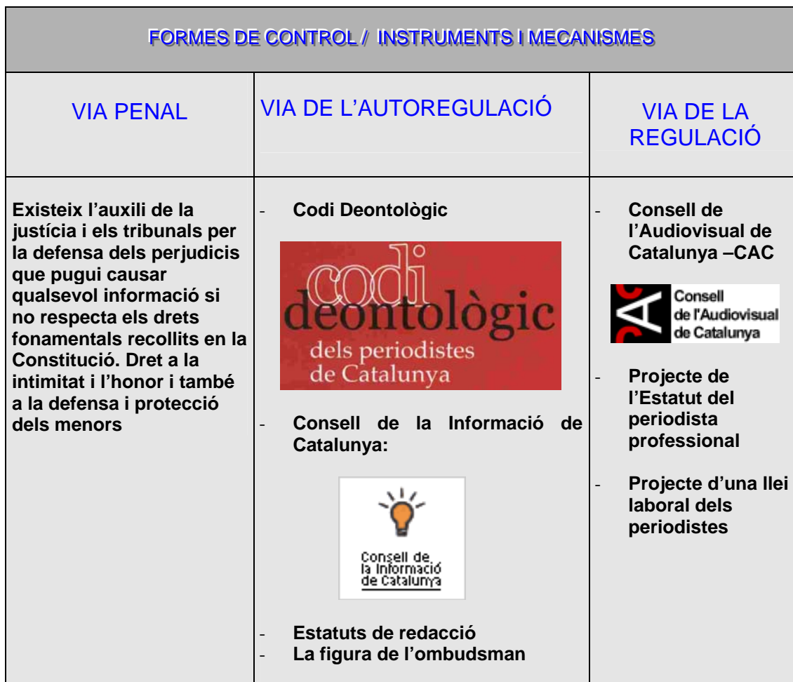
TAULA 5. FORMES DE CONTROL DE LA INFORMACIÓ A CATALUNYA . INSTRUMENTS EXISTENTS O EN VIES DE CREACIÓ.