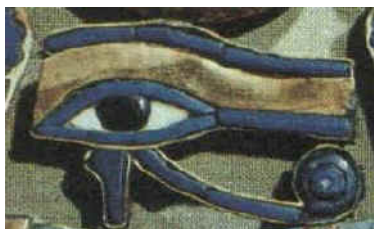
Figura 10 Amulet