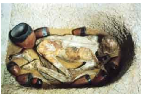
Figura 6. Mòmia. Museu Britànic