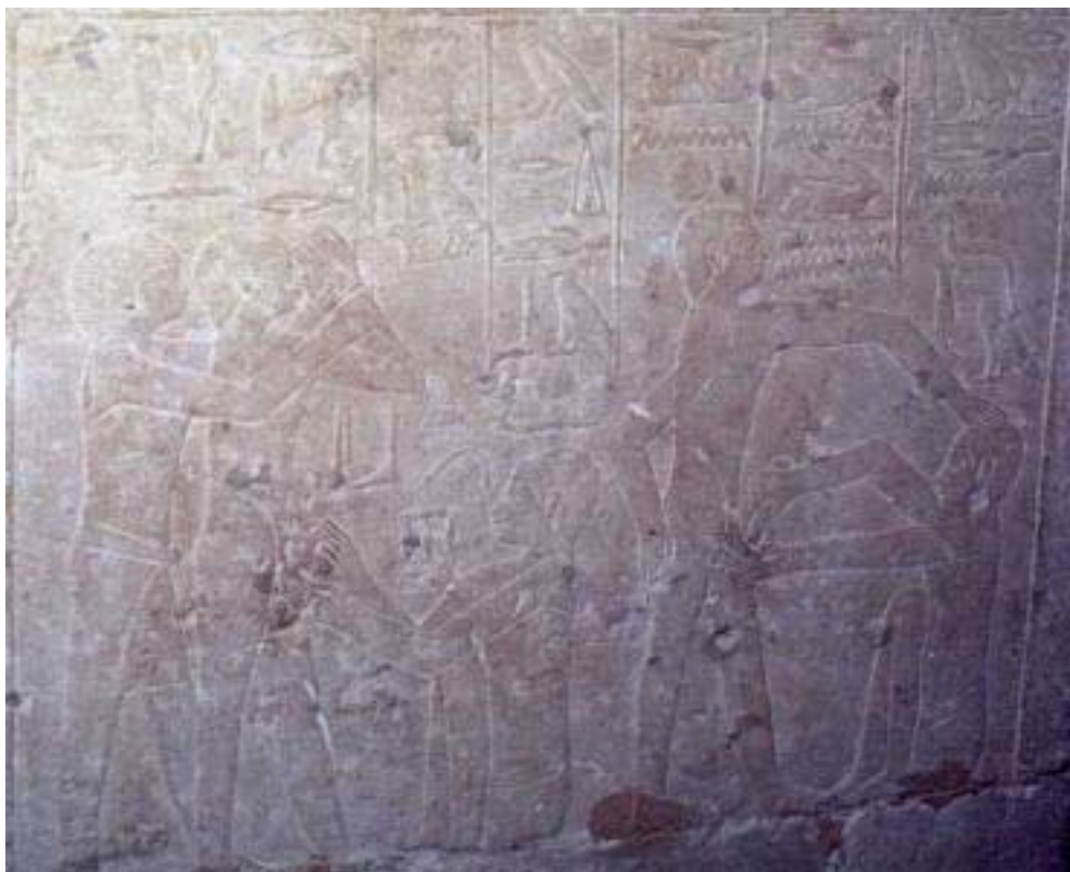
Figura 7 Circumcisió en la tomba d'Ankh-ma-hor,VI dinastia, a Saqqara.