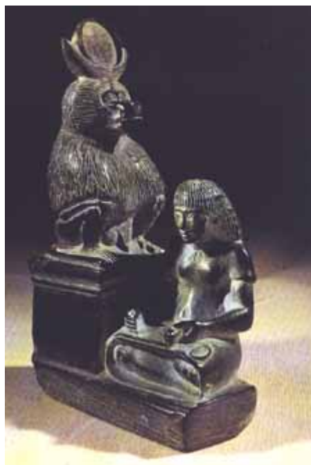
Figura 4 Thot