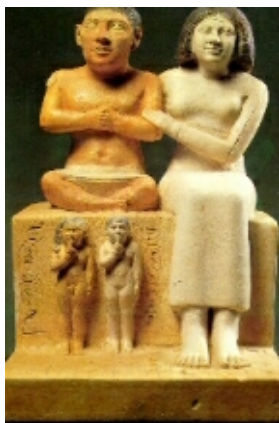
Figura 8 Snebe, IV dinastia, tomba de Gizeh, actualment en el Museu de El Caire.