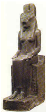
Figura 1 Sejmet