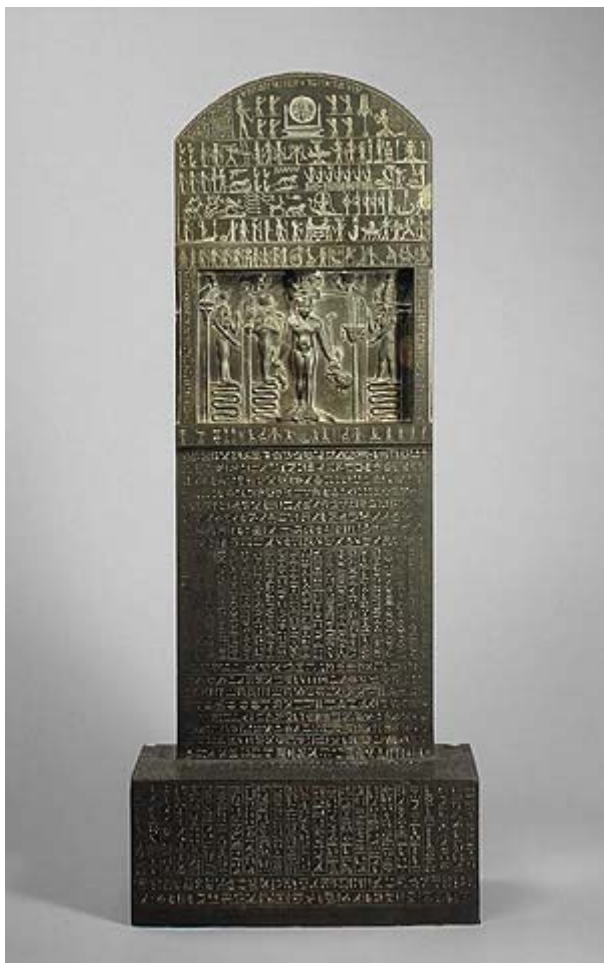
Figura 11 Estela Metternich. Museu Metropolità d'Art de Nova York.