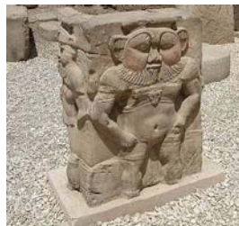
Figura 2 Bes