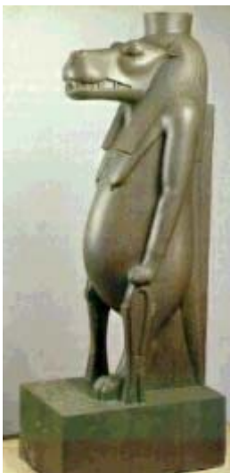
Figura 3 Taweret