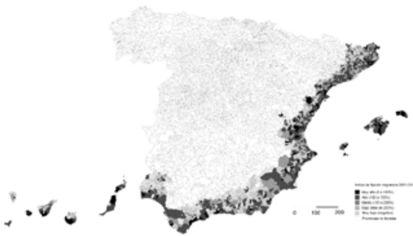
MAPA 2 ÍNDICE DE FIJACIÓN DE MIGRANTES. 2001-2011

Fuente: Elaboración propia a partir de datos del censo de población. INE.