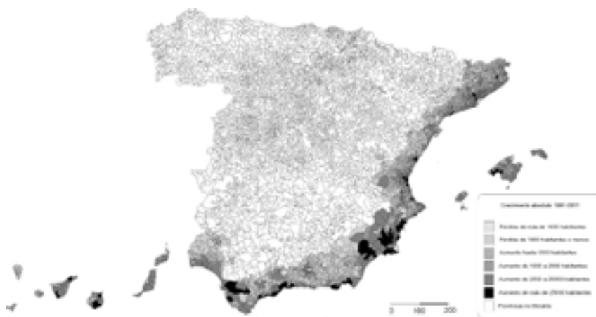
MAPA 1 CRECIMIENTO DEMOGRÁFICO ABSOLUTO. 1991-2011

Fuente: Elaboración propia a partir de datos del censo de población. INE.